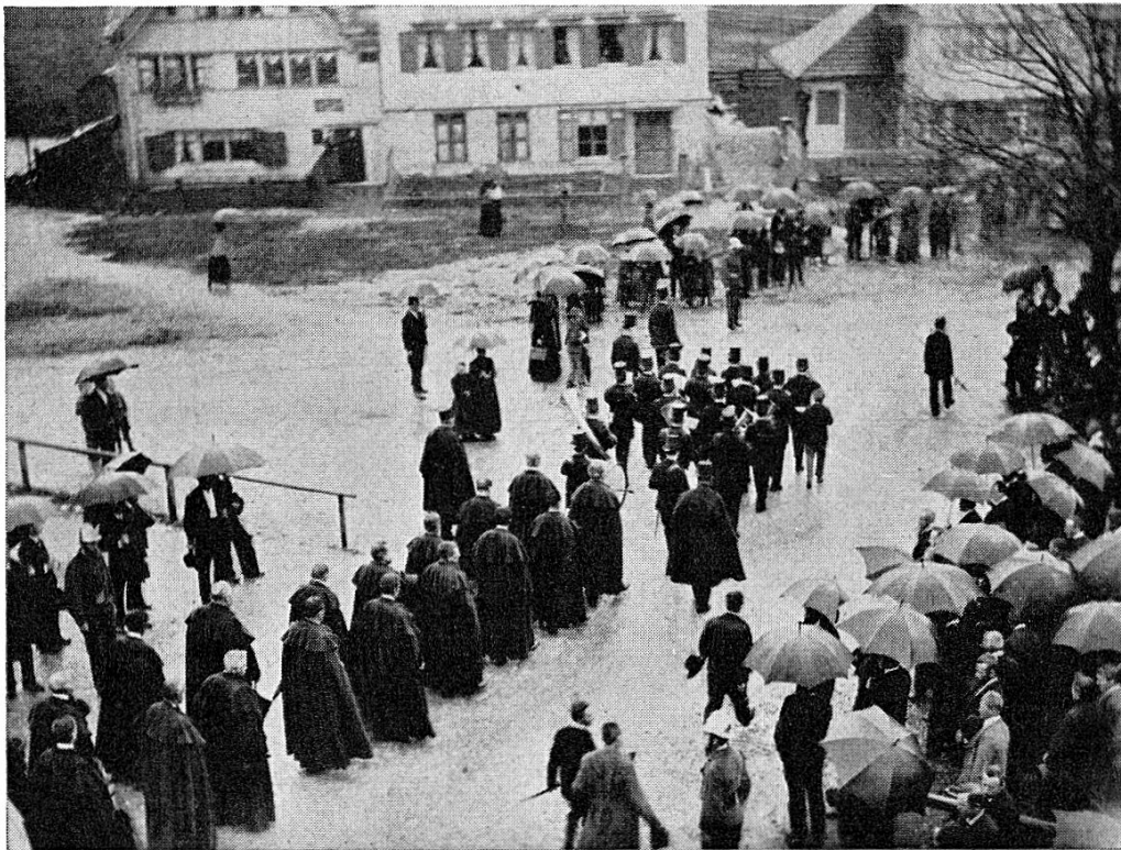
Abb. 3. — Landsgemeinde-Aufzug im Jahre 1894. — Photo aus der «Collection du Prince Roland Bonaparte». Kantonsbibliothek Appenzell I. Rh.

einen so langen Zug ergeben, dass Ebel 1) , der uns die eingehendste Darstellung einer alten Landsgemeinde geboten hat, nicht hätte sagen können, dass ihm der Aufzug bald entgangen wäre, so anspruchslos und einfach sei er gewesen. Ein Grossratsbeschluss von 1855 verpflichtete die «Herren Beamtete und Hauptleute», mit dem Landammann auf den Gemeindeplatz zu ziehen. Nach der 1873 in Kraft getretenen heutigen Kantonsverfassung, die einen schärferen Trennungsstrich zwischen Kantons- und Gemeindebehörden (letztere Bezirksräte genannt) zog, wurden logischerweise die Standeskommission und das Kantonsgericht als jene Behörden bezeichnet, welche am Aufzug teilnehmen sollen, als jene Behörden, die auch durch die Landsgemeinde gewählt werden. Nur nebenbei sei erwähnt, dass früher Ratschreiber und Gerichtsschreiber als Aktuare der vorerwähnten Behörden mitgingen, was aber, da sie nicht der Landsgemeindewahl unterstehen, in neuerer Zeit aufgegeben wurde.