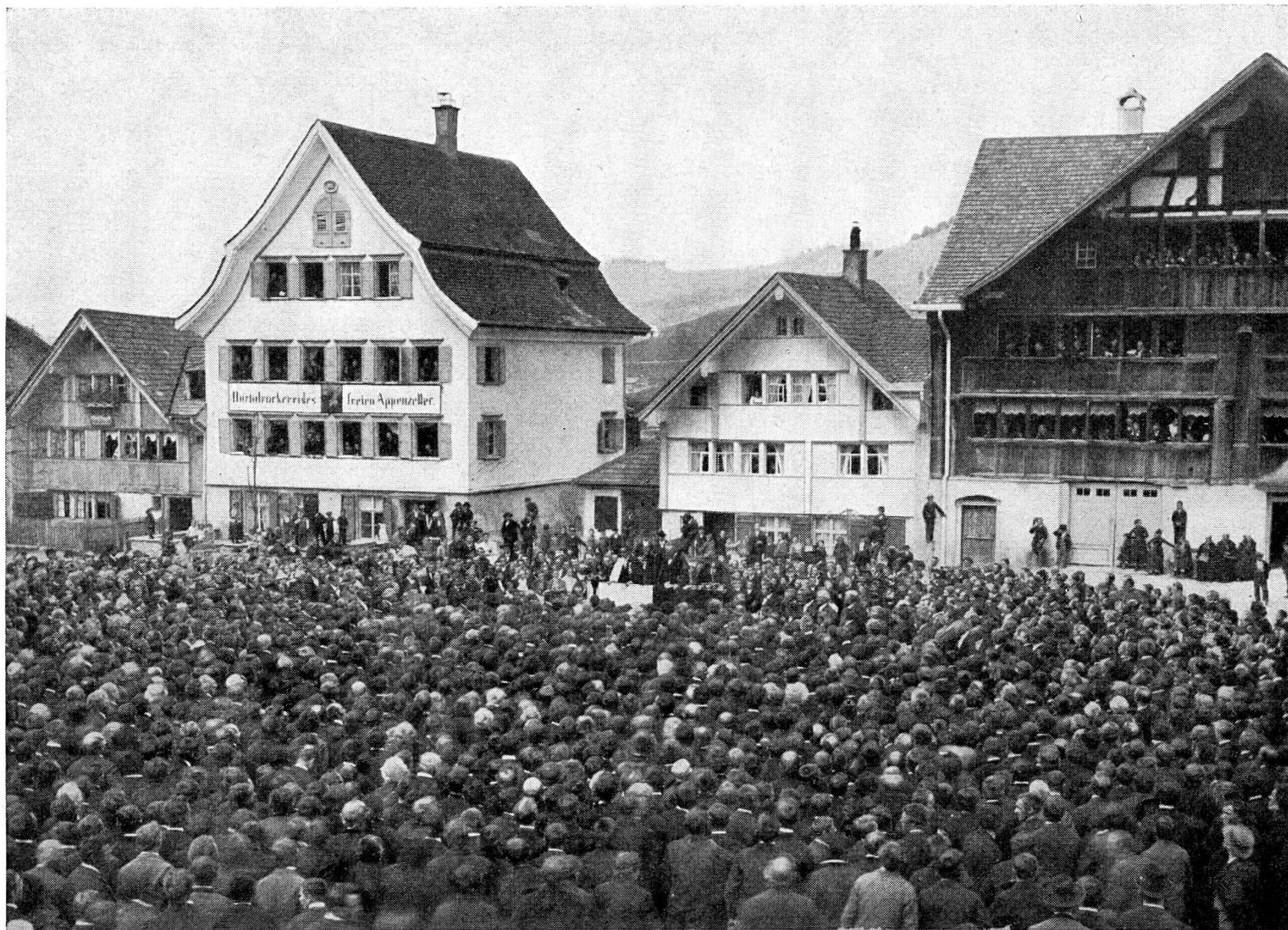
Abb. 7. — Landsgemeinde 1887