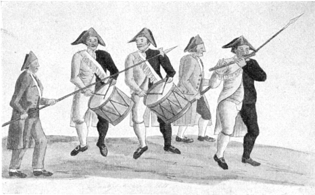
Abb. 4. — Trommler, Pfeifer und Hellebardenträger, 1831. Im Besitze der Erben von Dr. A. Rechsteiner, Appenzell.

durchziehe, wobei dann um ca. 12 1/2 Uhr der Aufzug zur Landsgemeinde beginne. Das ist die einzige uns bekannte Stelle, welche diese Abart überliefert.