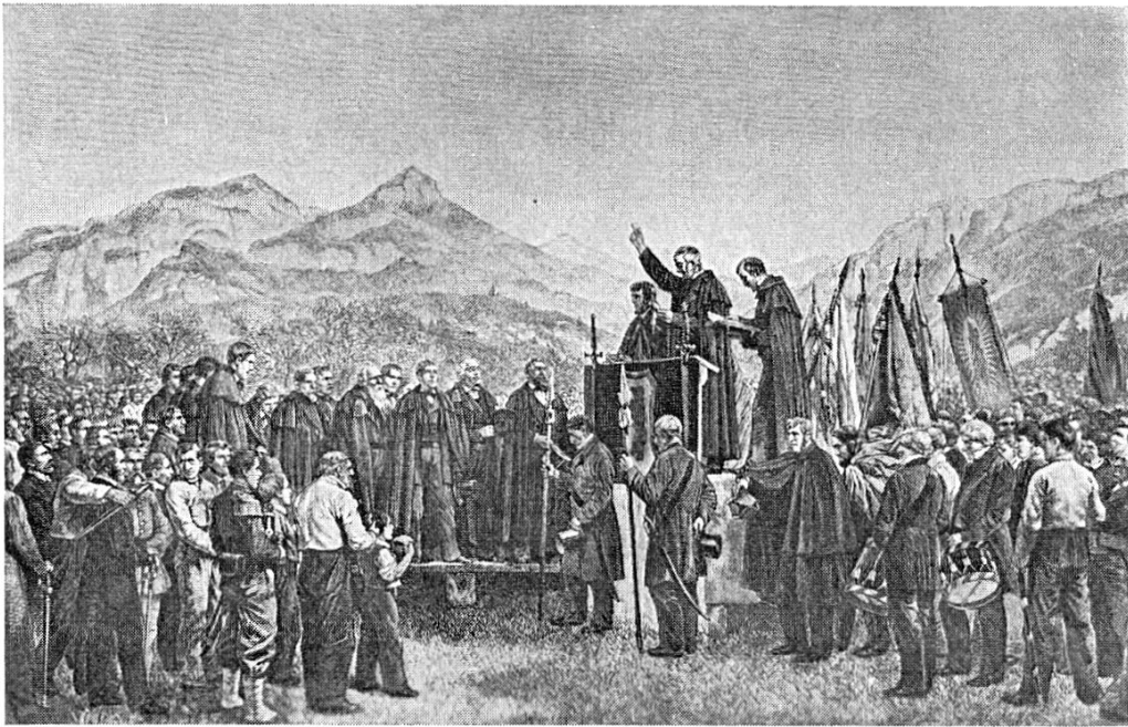
Abb. 6. — Landsgemeinde in Appenzell 1875. Bild (auch als Tonbild oder Stich bekannt) von W. Riefstahl. Der Künstler hat den Hintergrund freigestaltet. Abdruck in «Das Schweizerland», herausgegeben von W. Kaden, Stuttgart o. J.

bürger). Die letzteren sind dazu benannt worden, seitdem nach Bundesrecht auch die niedergelassenen Bürger anderer Kantone stimmberechtigt geworden sind.