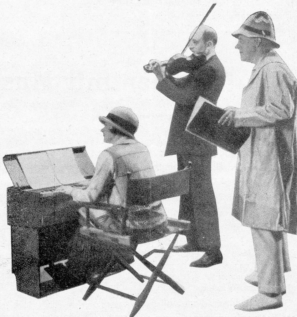
Commodore Blackton mit Violonist und Klavierspieler