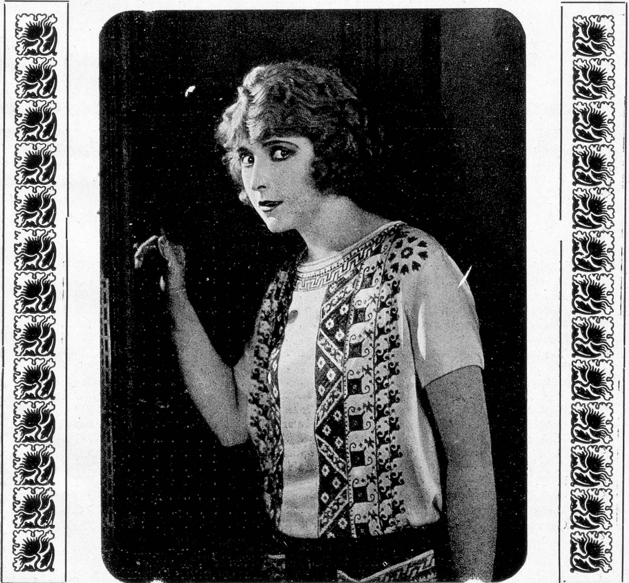
Pearl White in « Terreur ».