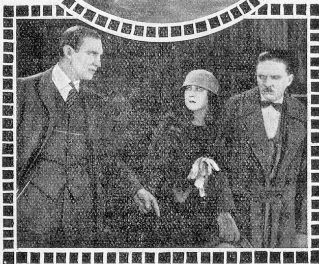
Szenenbilder aus « L'Epave tragique ».