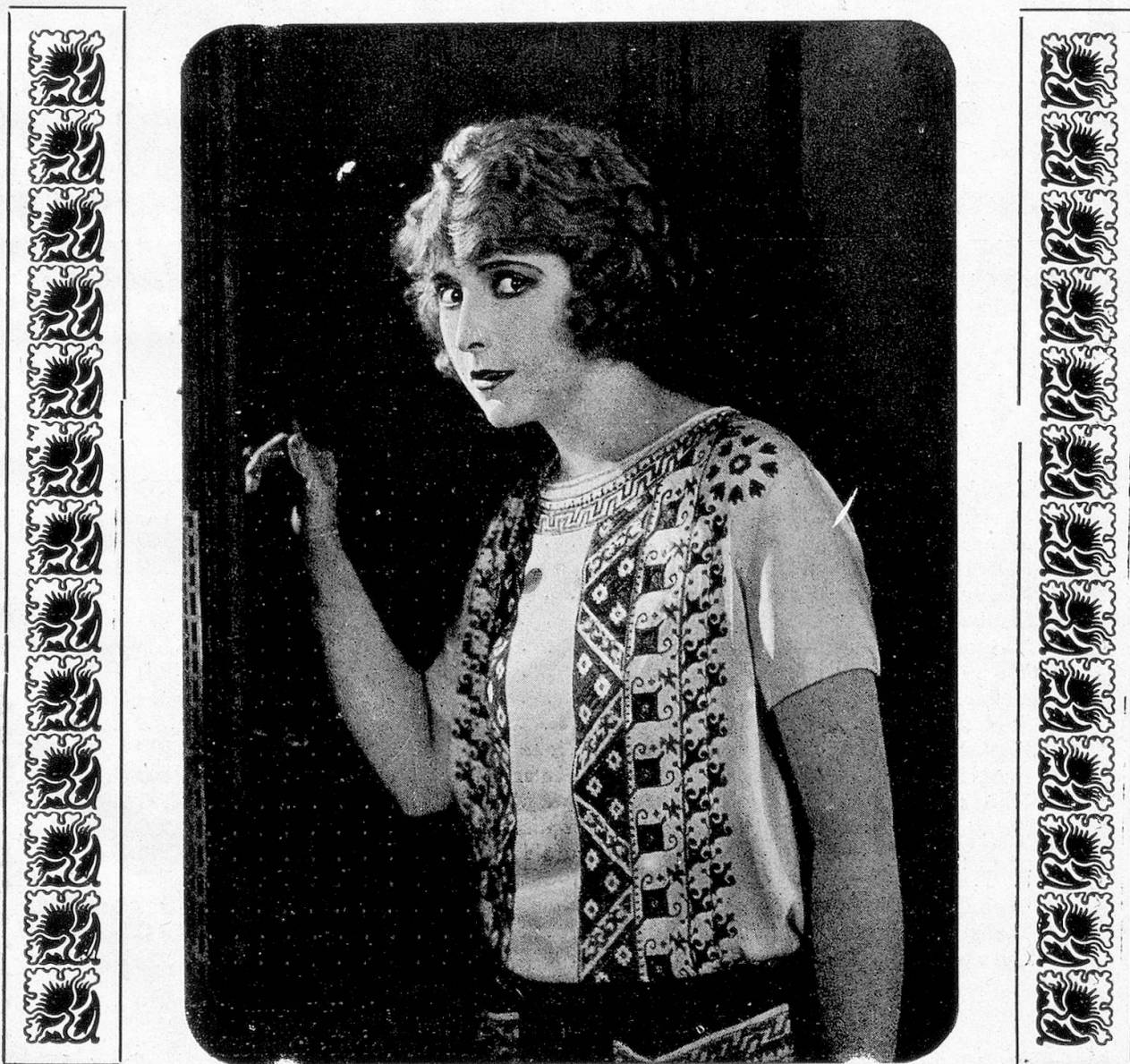
Pearl White in « Terreur ».