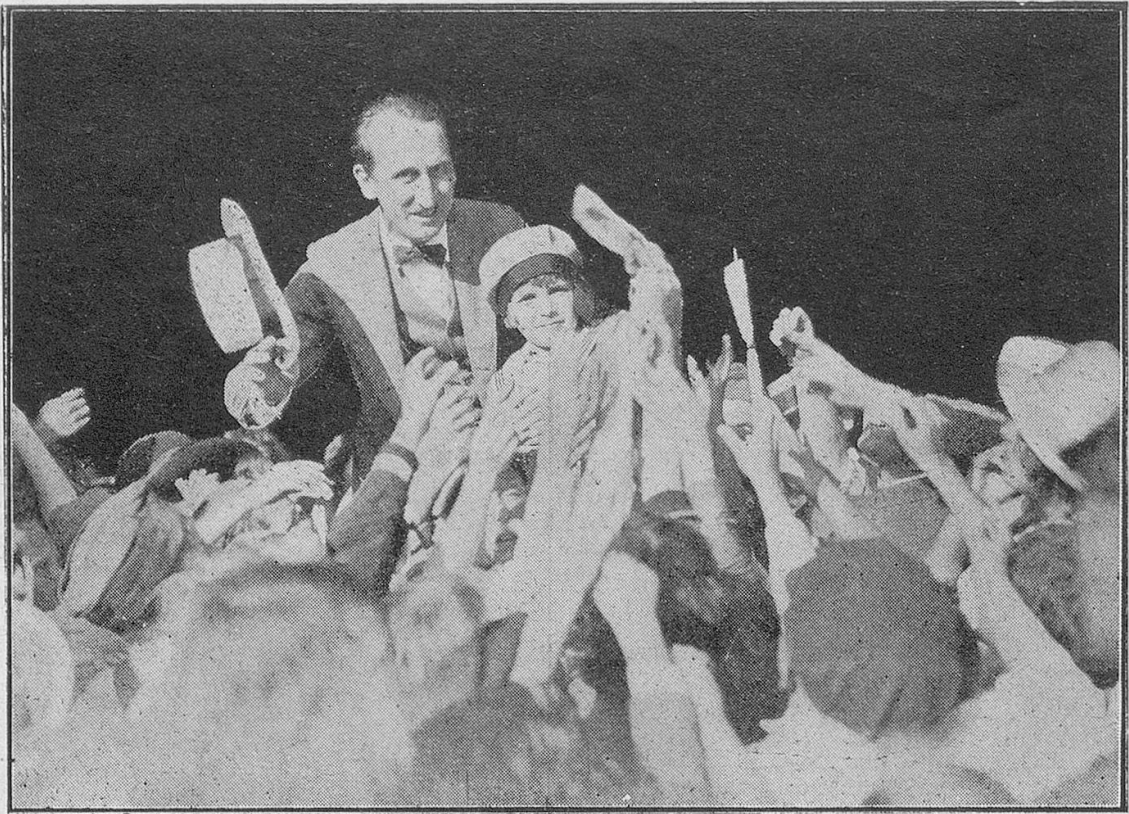
Die Ankunft Jackie's in London.