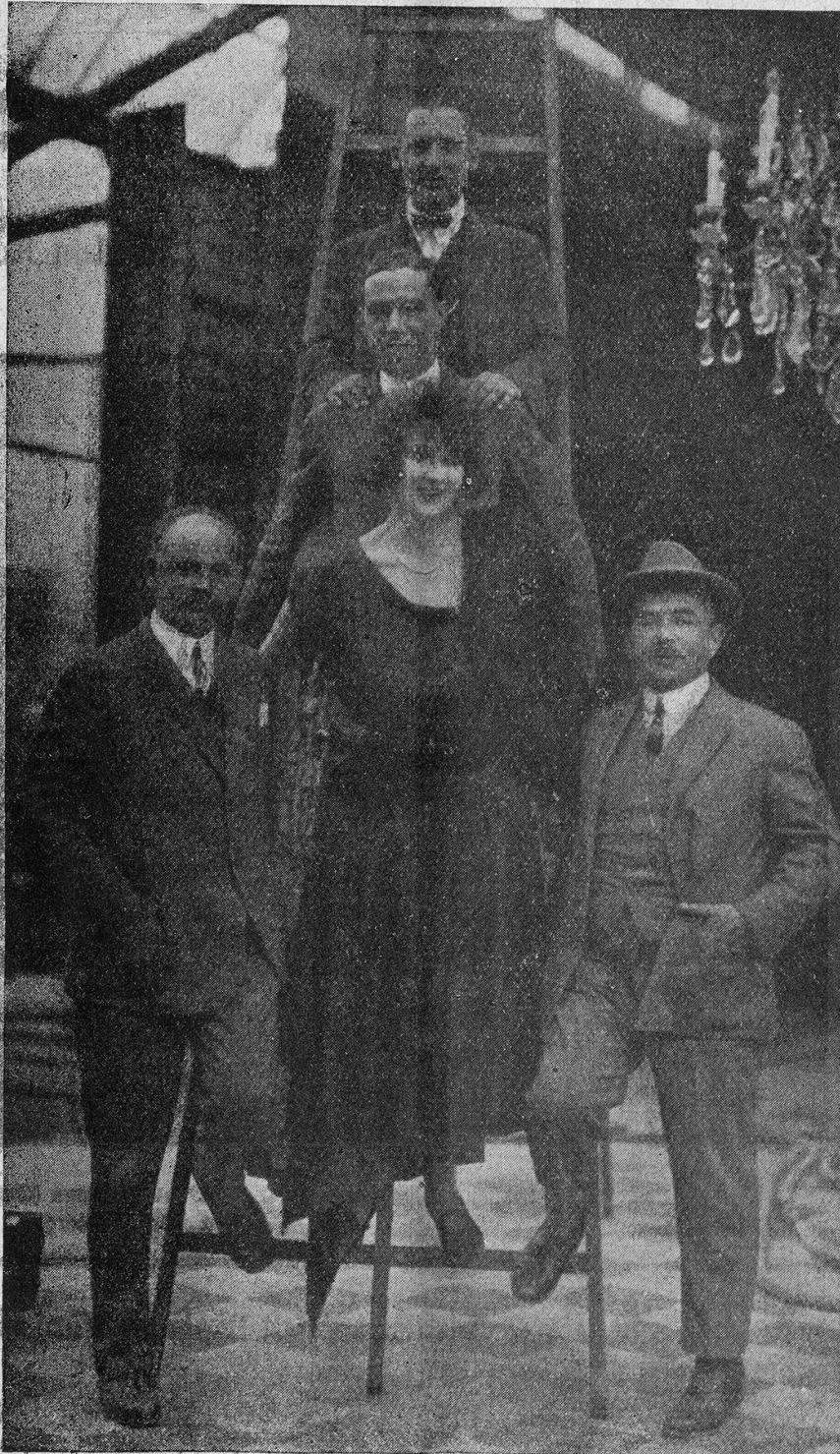
Dir. Oftermayer (Mestro-Film)

Daß es auch auf einer Studienreise nicht immer rein geschäftliche Augenblicke geben muß, zeigt die untenstehende Momentaufnahme, die ins Atelier der „Mestro“-Filmgesellschaft München führt, in dem Lucie Doraine filmt. Ihre neuesten Bilder, „Die Königin der Mode“ und „Die fünfte Straße“ erscheinen im „Emelka-Verleih“ Zürich.