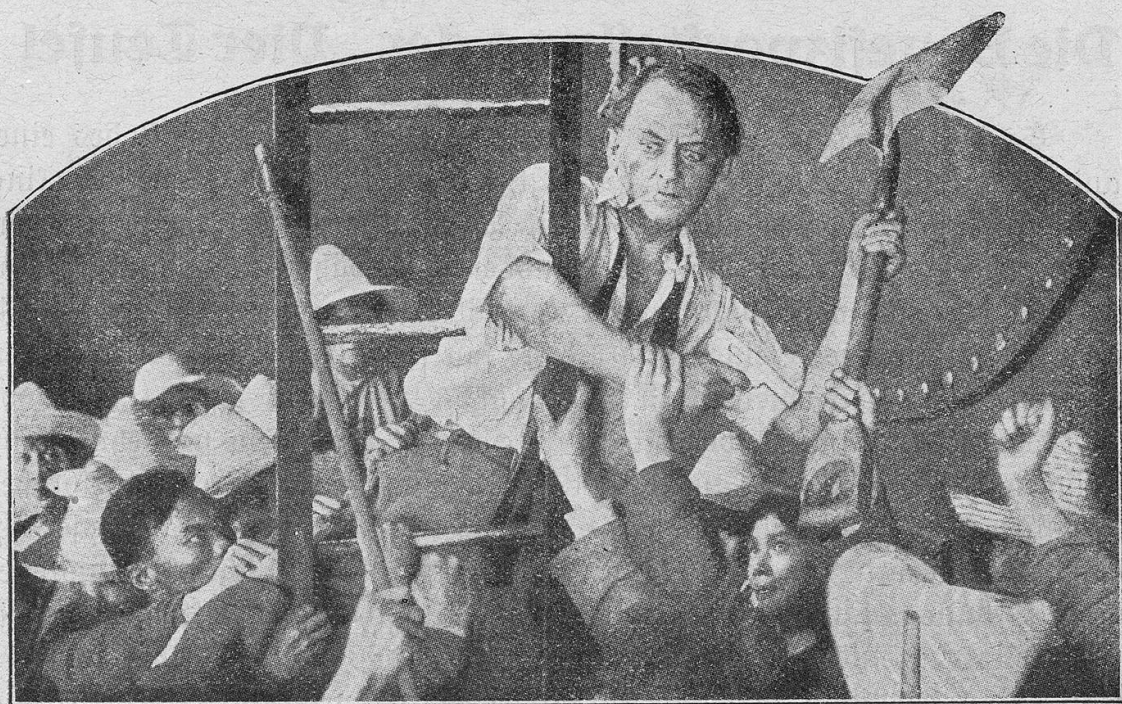
Szenenbild aus „Schiffe und Menschen“.