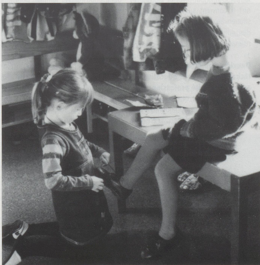
Crèche aux Chaudoudoux

Leur représentation dans les milieux politiques doit donc absolument être renforcée. Ainsi, pour que la parité politique soit respectée au mieux, les femmes de la JSPJ sont motivées et encouragées à se présenter sur les listes électorales.