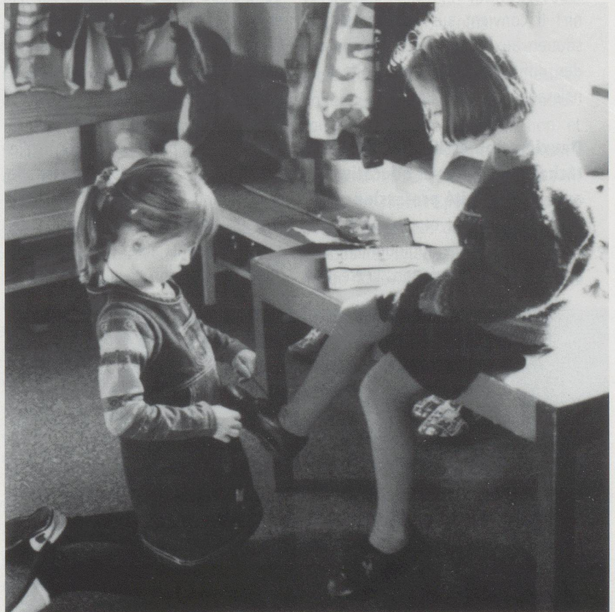
Crèche aux Chaudoudoux

Leur représentation dans les milieux politiques doit donc absolument être renforcée. Ainsi, pour que la parité politique soit respectée au mieux, les femmes de la JSPJ sont motivées et encouragées à se présenter sur les listes électorales.