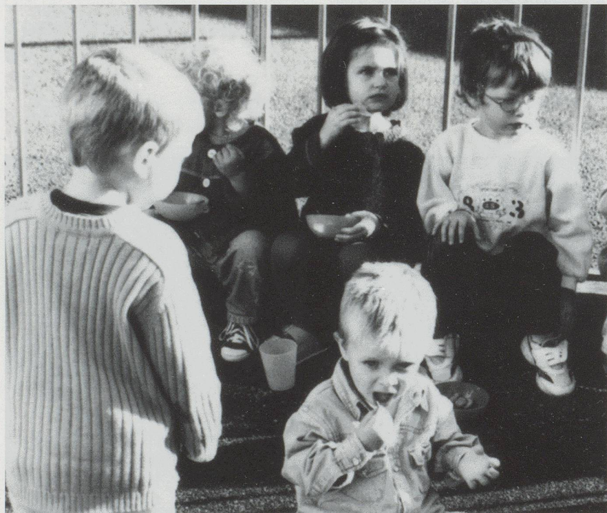
Crèche aux Chaudoudoux