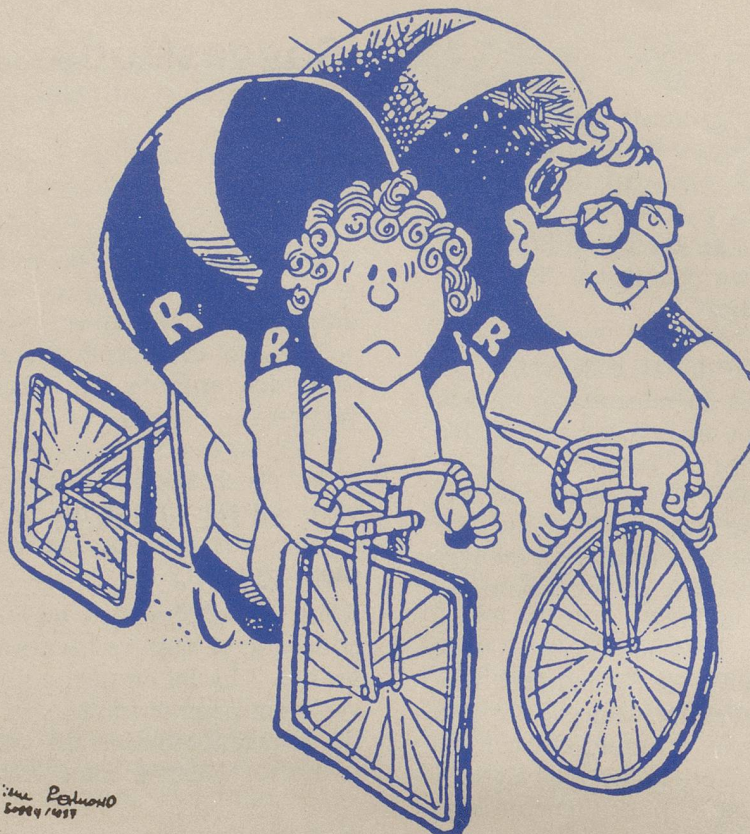
QUE LE MEILLEUR GAGNE.

Finalement, ce sont 75 personnalités, largement représentatives de divers milieux politiques, syndicaux, féministes et culturels, qui ont soutenu officiellement cet Appel. Si elles ne partagent pas forcément les mêmes conceptions sur ce que devrait être l'AVS dans le futur, ces premières signataires ont tenu à manifester leur unité dans leur opposition déterminée à cette proposition du Conseil fédéral.