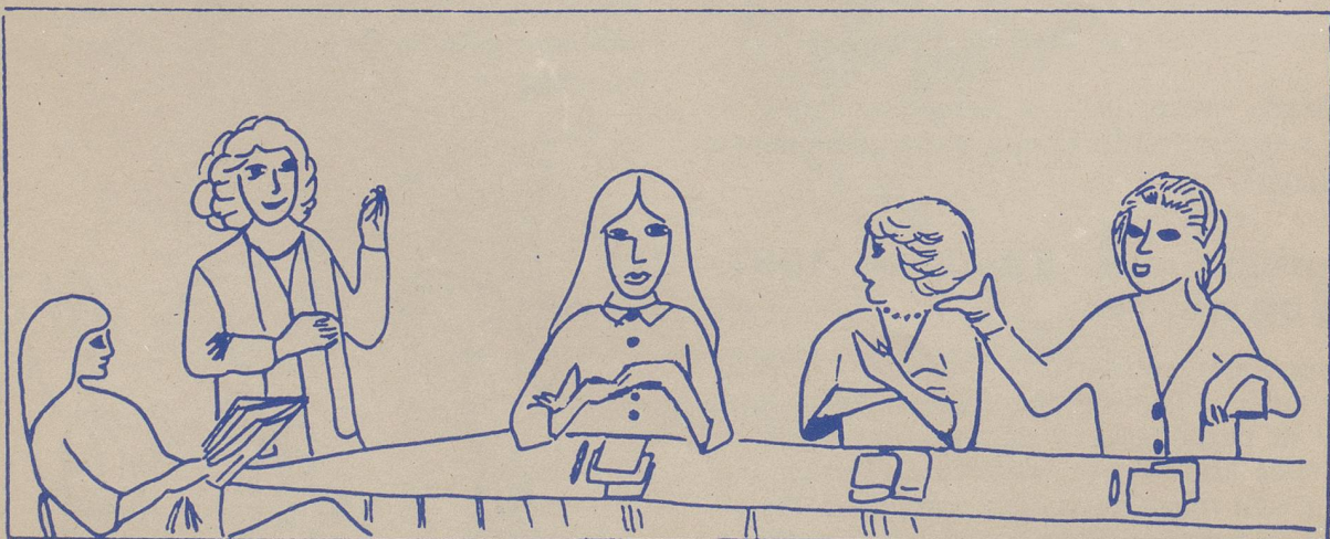
dessin Christine Barré

Très longtemps, on a pensé que les régions pauvres et périphériques étaient condamnées à vivre dans l'ombre des régions riches et industrielles. La restructuration industrielle et l'avènement d'industries dites de pointe donnent une chance aux petites et moyennes entreprises et aux régions périphériques d'échapper enfin au déterminisme économique et cela d'autant plus que ces régions (l'Arc horloger en particulier) ont des atouts sérieux dans leur jeu : qualification du personnel, facilité d'adaptation, esprit d'entreprise... Ces atouts doivent cependant être mis en valeur en particulier par un développement de la formation professionnelle et par une intervention conjointe des pouvoirs