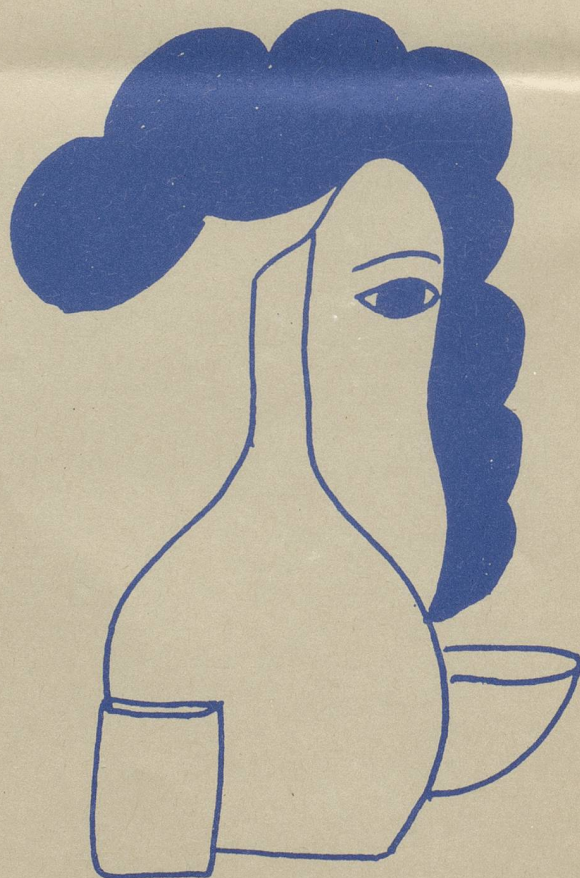
(dessin Christine Barré)

Ainsi les membres du Centre de Liaison et toutes les Jurassiennes s'associèrent pour fêter les créatrices, pour fêter le quatrième anniversaire du Centre de Liaison jurassien.