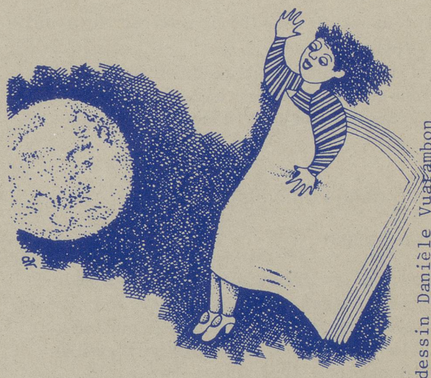
dessin Danièle Vuarambon

La bibliothèque comprend plus de 600 livres. Les domaines les plus volumineux concernent le droit, l'histoire et la lutte des femmes, l'économie, la famille et la santé-sexualité.