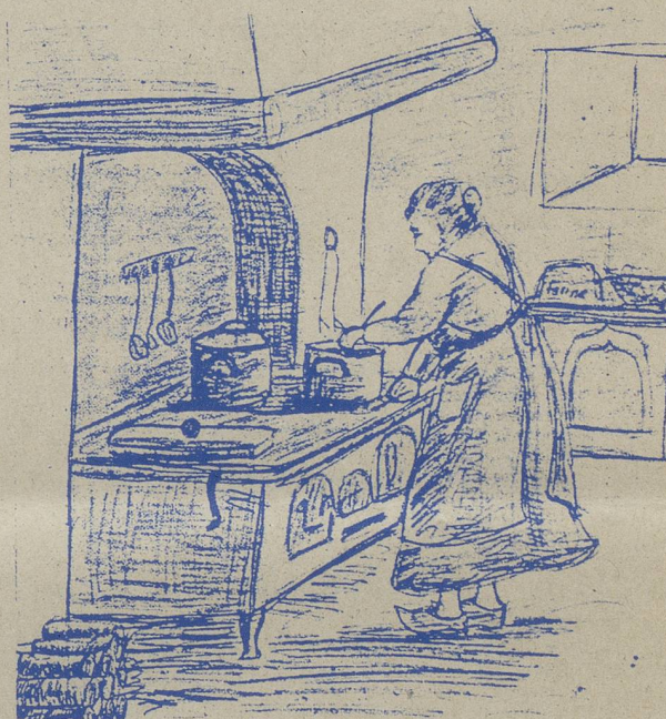
(Illustration de Viviane Gogniat)

En partageant le verre de l'amitié, les invités ont pu déguster d'excellentes pâtisseries confectionnées par les paysan- nes. Par ce geste, l'Association des paysannes tenait à signaler la sortie prochaine du merveilleux recueil : "Vieil- les recettes de chez nous". *