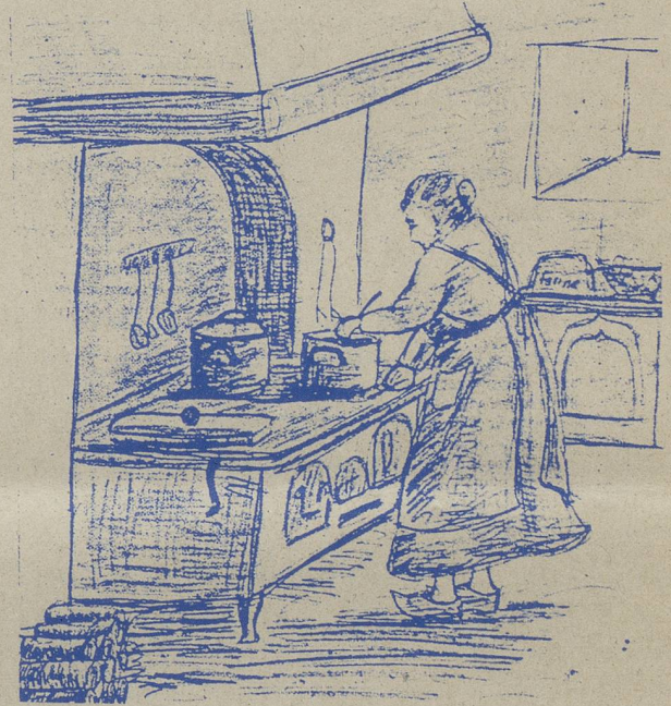
(Illustration de Viviane Gogniat)

En partageant le verre de l'amitié, les invités ont pu déguster d'excellentes pâtisseries confectionnées par les paysannes. Par ce geste, l'Association des paysannes tenait à signaler la sortie prochaine du merveilleux recueil : "Vieilles recettes de chez nous". *