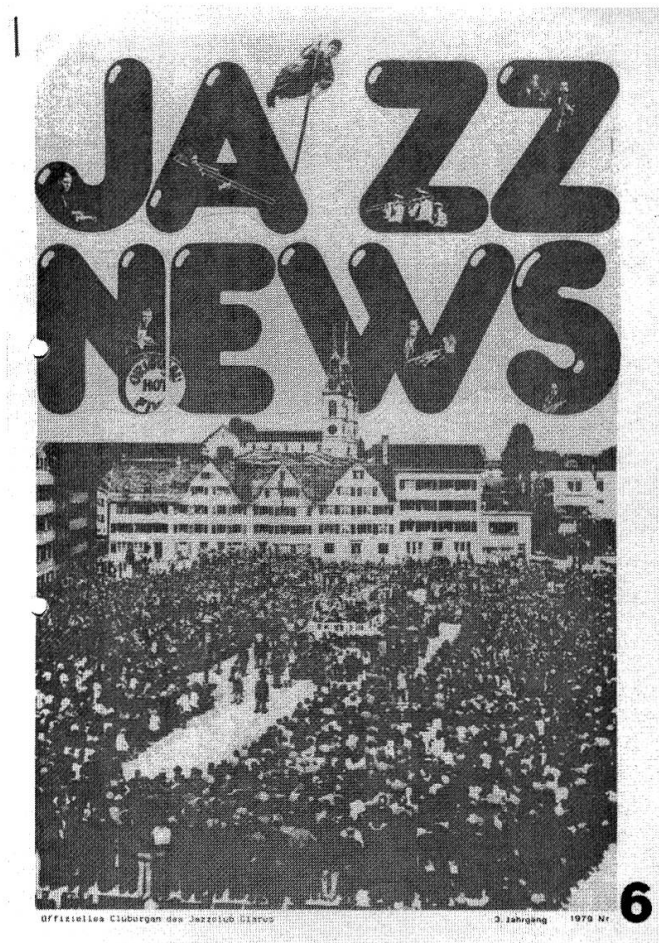
1. November 1979: Jazz News Nr. 6, 3. Jahrgang, Organ des Jazzclub Glarus.