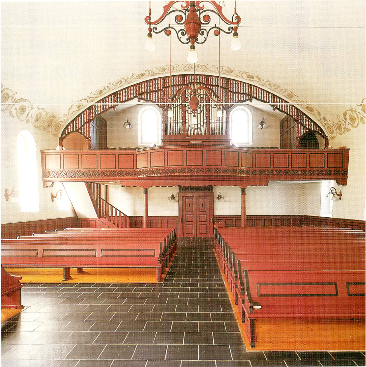
Inneres gegen die Empore nach der Restaurierung von 1975 bis 1977; charakteristische Farbgebung von 1915. Neuer, stilistisch angepasster Orgelprospekt.