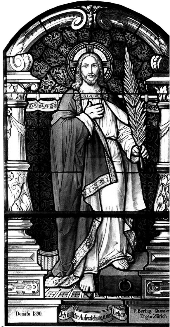
Links: Die Kanzel nach der Umgestaltung von 1977. Korb in Renaissanceformen von 1619; Aufgang und Rückwand von 1915; Schalldeckel von 1915, vergrößert 1977; neue Säule nach einem Vorbild von 1599. – Rechts: Südliches Chorfenster mit Glasmalerei von Friedrich Berbig, 1890. – Unten: Geschnitzter spätgotischer Fries der ehemaligen Holzdecke von 1487, der 1857 in die Brüstung der neuen Empore eingesetzt wurde.