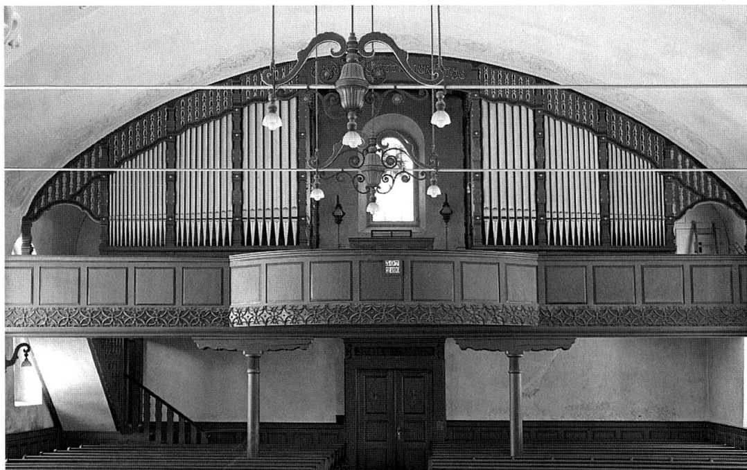
Inneres gegen die Empore zwischen 1915 und 1975. Gewölbe und Empore von 1857; Lampen und zweiteiliger Orgelprospekt 1915 von Streiff & Schindler.