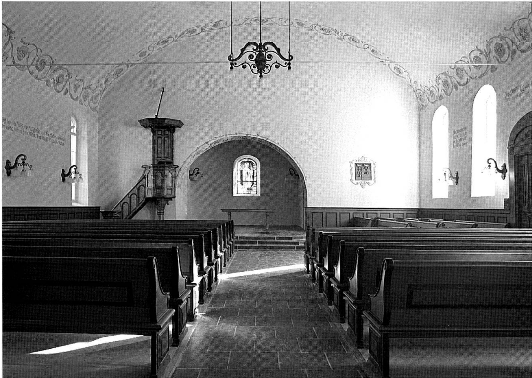
Reformierte Kirche Betschwanden. Inneres gegen den Chor; nach der Restaurierung von 1975 bis 1977.