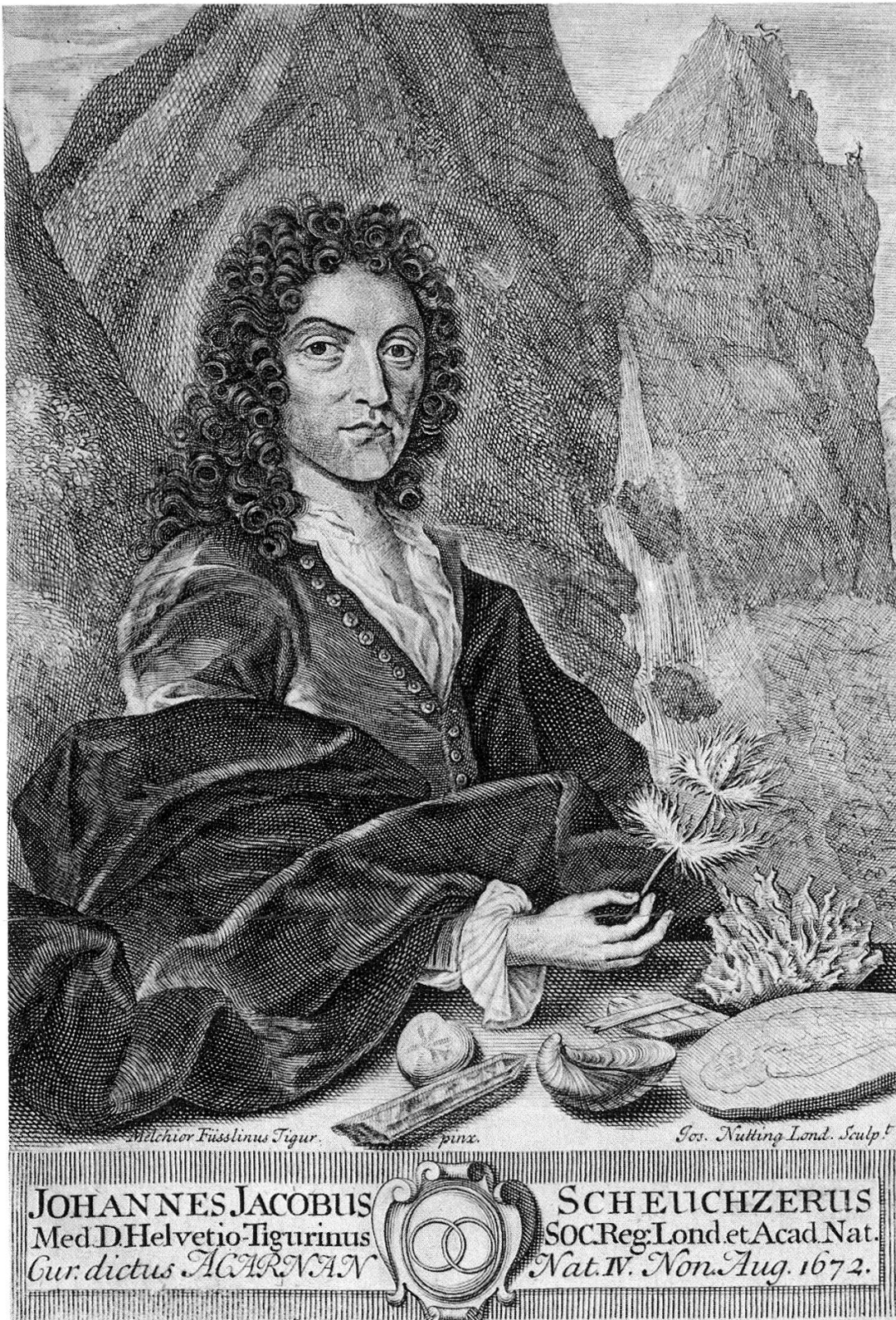
Joh. Jakob Scheuchzer, Kupferstich von Nutting nach einer Zeichnung von Melchior Füssli, London 1708