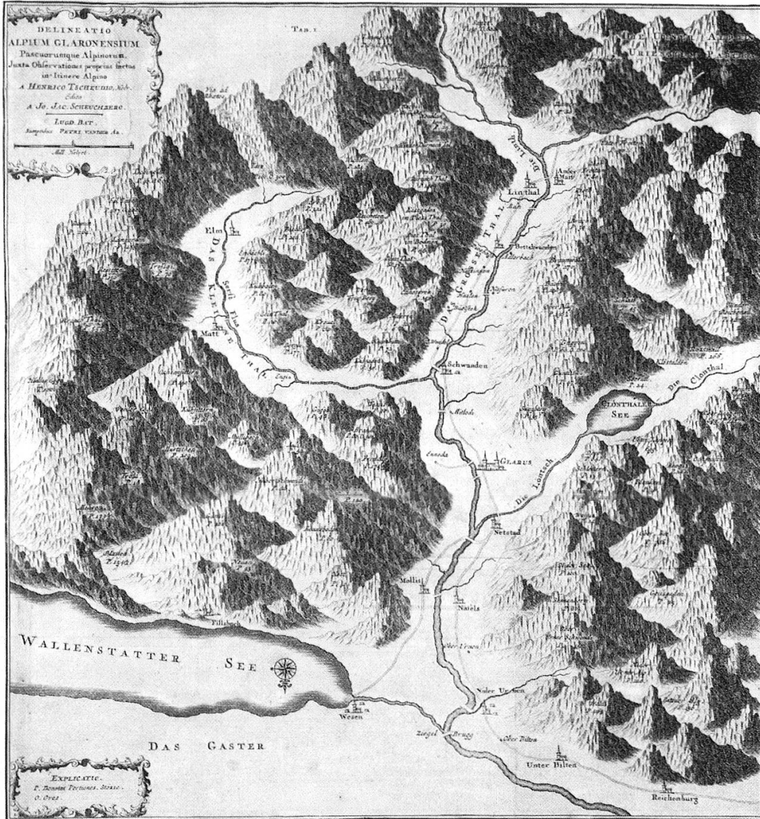
Landkarte des Kantons Glarus aus Scheuchzers Itinera Alpina, nach Joh. Heinrich Tschudi, Leyden 1723