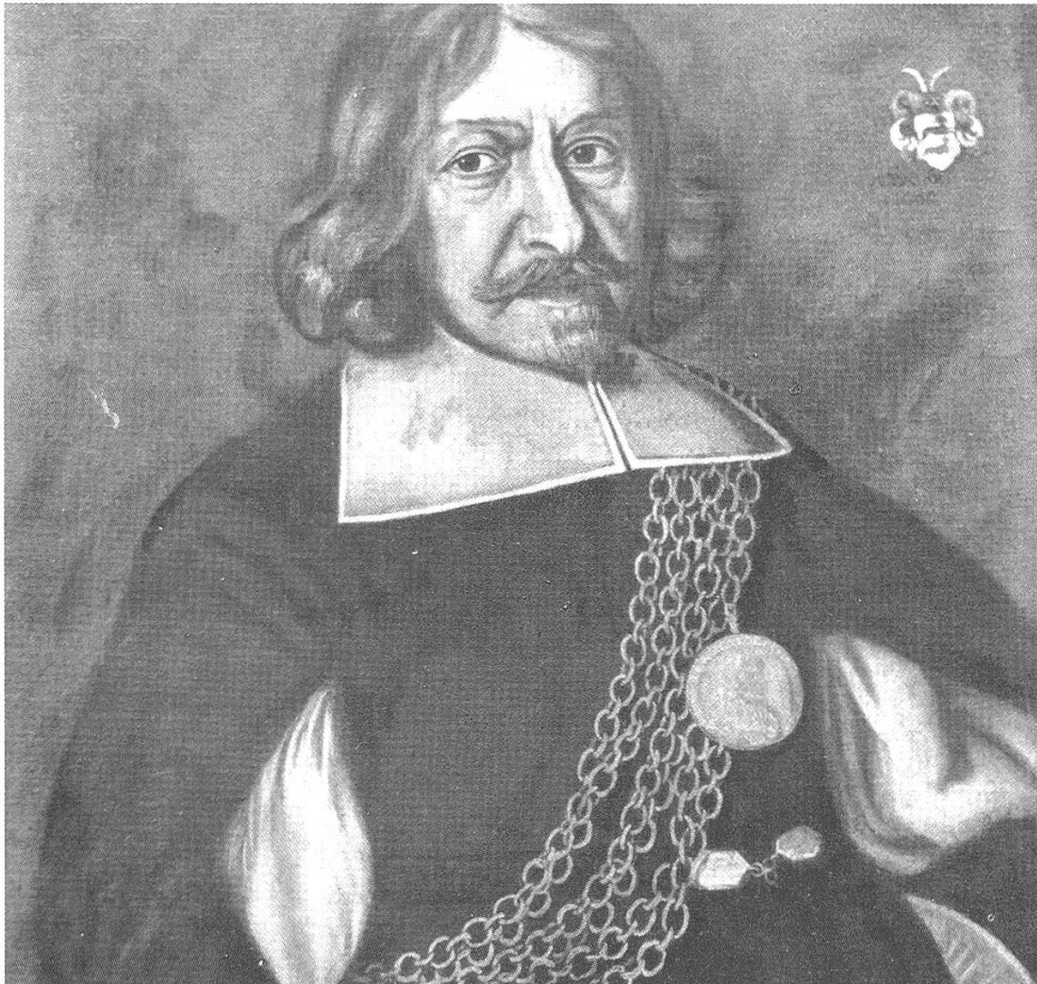
Johann Heinrich Elmer (1600–1679), Ölbild, datiert 1660. In: JBGL 46, Tf. X (Museum des Landes Glarus, Freulerpalast)

Er weilte 1687 seit drei Jahren in Brie-Comte-Robert (südlich von Paris) zu Studienzwecken und starb 1708 als Leutnant in Flandern. Karl Josef Gallati (1765–1787) (Nr. 121) absolvierte von 1779 bis 1785/86 die Jesuitenschule in Luzern, erhielt 1786 das französische Stipendium und studierte 1787 in Strassburg, als der französische Hof die Stipendienzahlungen einstellte. 43