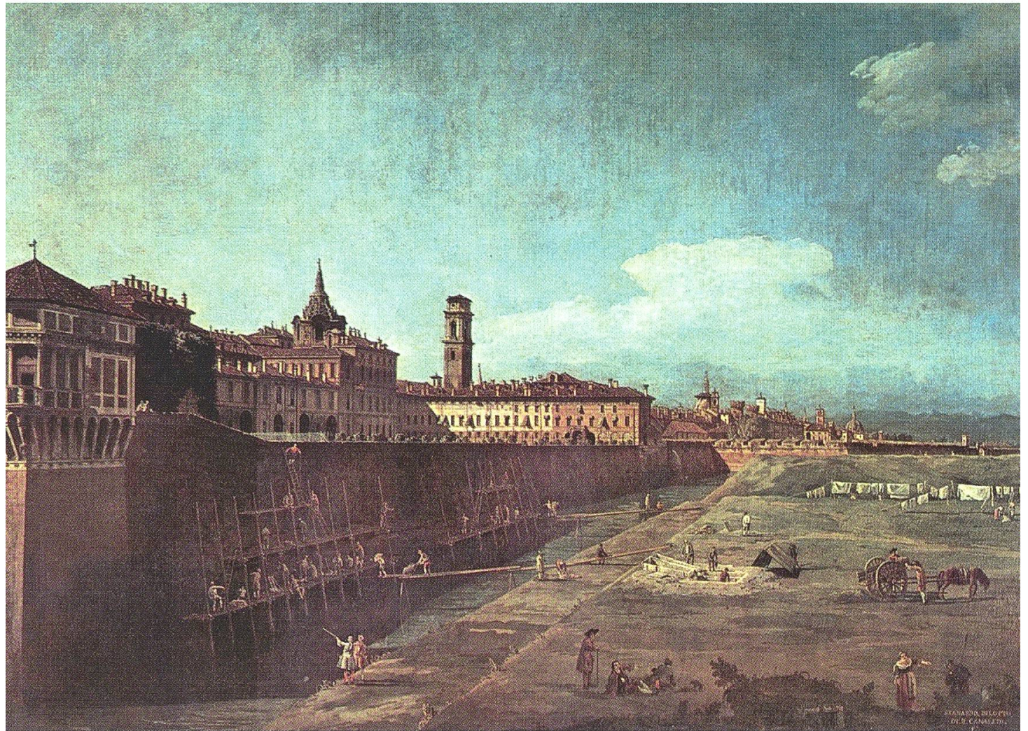
Ansicht von Turin, Gemälde von 1745 von Bernardo Bellotto (1721–1780).