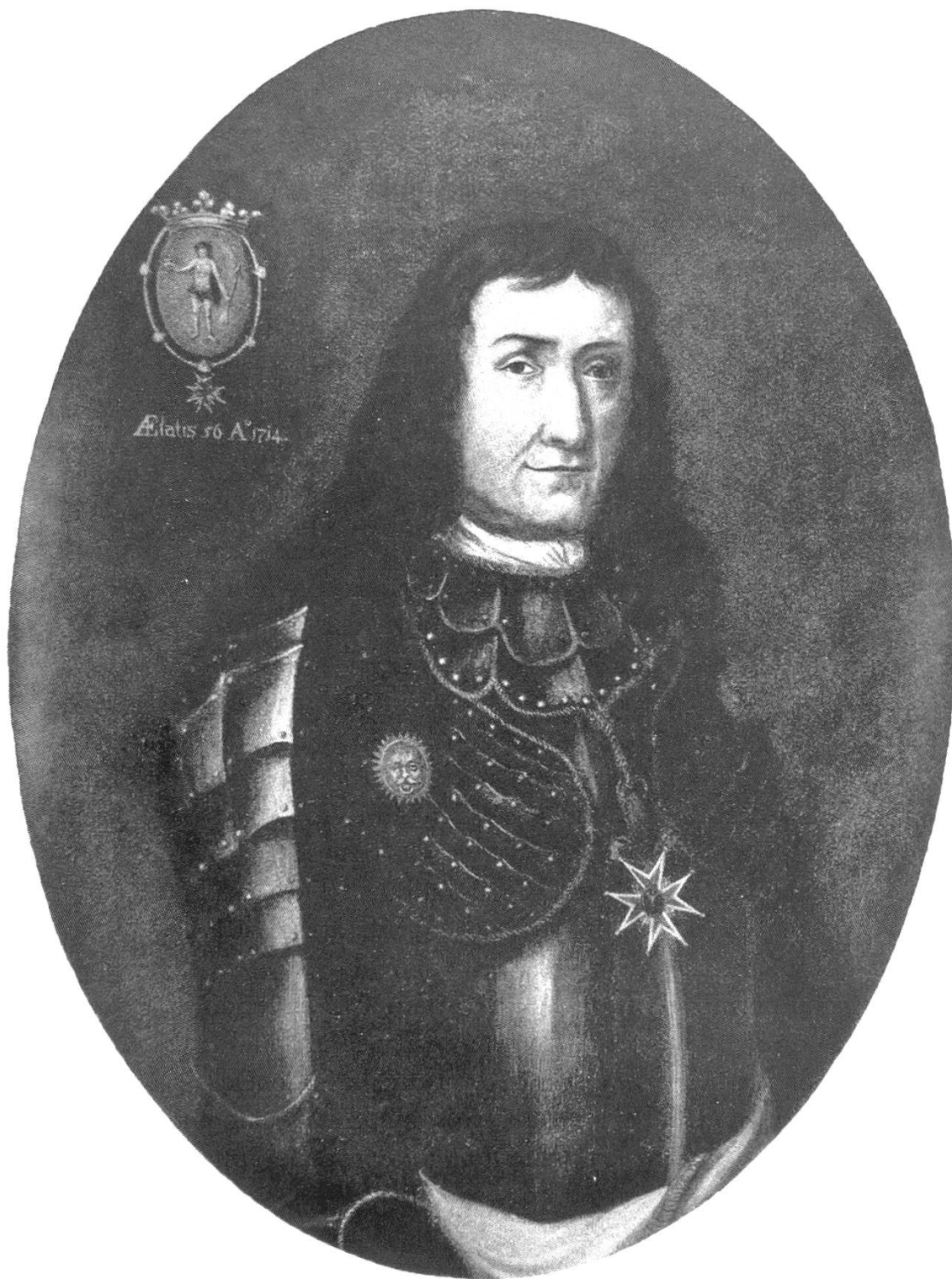
Kaspar Josef Freuler (1658–1723), Hauptmann, Landammann. Ölgemälde. In: JBGL 47, Tf. XIV (Museum des Landes Glarus, Freulerpalast)