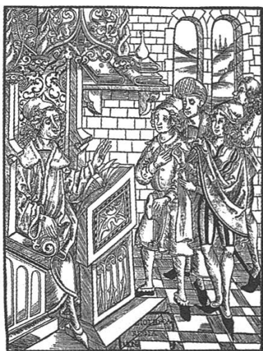
Universitätslehrer und Studenten. Holzschnitt aus Brunschwig «Chirurgia», 1497.

1771 setzte der Rat mit Einverständnis der Jesuiten eine Studienordnung in Kraft, die dem neuen Bildungsideal des 18. Jahrhunderts entsprach. Auf der Gymnasialstufe wurden die Realien und die praktischen, im täglichen Leben anwendbaren Fächer aufgewertet. Die deutsche Sprache wurde dem Lateinischen gleichgestellt, vermehrt Geschichte und Arithmetik (praktisches Rechnen) betrieben. Das Griechische verschwand. Das Gymnasium wurde um eine Klasse verkürzt, dafür die Prinzipienschule aufgestockt. In der philosophischen Fakultät wurden Vorlesungen für Ethik und Mathematik eingeführt. Am Theologiestudium änderte sich wenig. 14 «Die Glanzzeit der Jesuitenkollegien war ohne Zweifel vorbei, und ihre Anziehungskraft schwächte sich in der Zeit der Aufklärung weiter ab.» 15