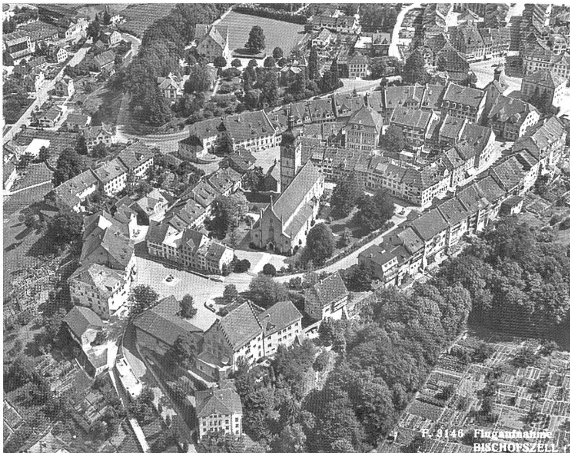
Bischofszell, ältere Flugaufnahme der mittelalterlichen Stadt.