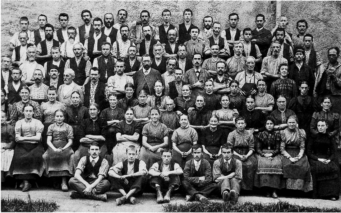
Arbeiterinnen und Arbeiter der Textildruckerei Trümpy, Schaeppi & Cie um 1900. Solche Aufnahmen sind ebenso selten wie Forschungen zu den Lebensbedingungen der Glarner Fabrikarbeitschaft.

Joris zeigt, dass dieser Weg nach wie vor erhellende Einblicke in die Vergangenheit bieten kann. In diesem Sinn hätte der Unternehmer und Politiker Eduard Blumer schon lange eine ausführliche Würdigung verdient. Als langjähriger Landammann ab 1887 übte er einen prägenden Einfluss auf das politische Geschehen im Glarnerland aus.