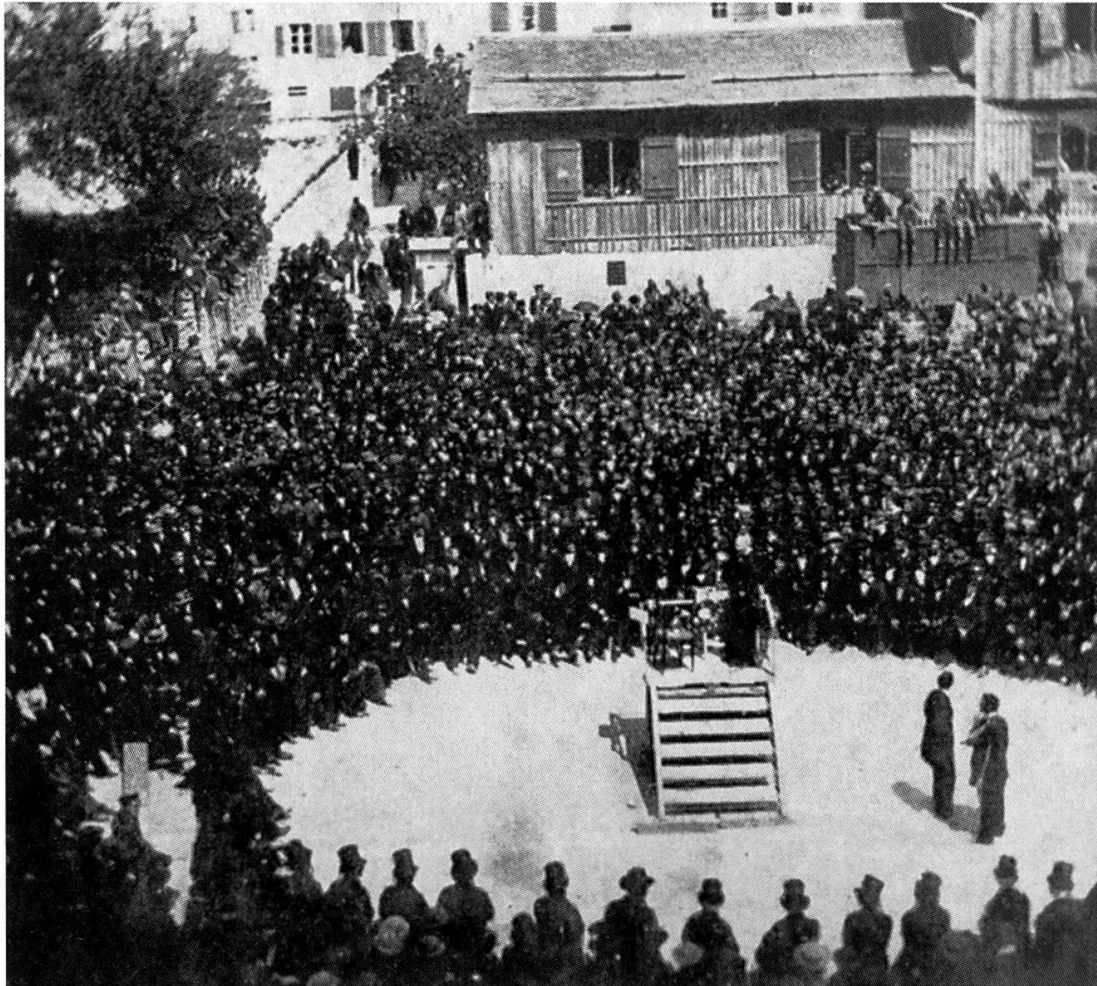
Die Landsgemeinde in einer verschollenen Aufnahme von 1861. Sie fällt schon im 19. Jahrhundert überraschende Entscheide, allerdings nicht immer auf demokratisch einwandfreie Art. (Nachdruck nach Winteler, Glarus, 1961)

verhielt sich die Mehrheit der Bevölkerung, die in der Mitte des Jahrhunderts noch nicht zur Fabrikarbeiterschaft zählte? Wie ist die Tatsache einzuschätzen, dass die Landsgemeinden von 1864 und 1872 tumultuös und undemokratisch verliefen? Warum warfen die drei ersten Fabrikinspektoren nach Ablauf der Amtszeit alle das Handtuch?