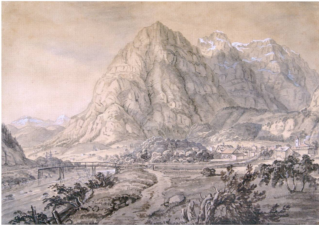
Netstal 1834, ein Dorf mit informativen geschichtlichen Darstellungen. Aquarellierte Zeichnung von Johann Rudolf Bühlmann, wiederentdeckt von Philipp Haas. (Graphische Sammlung der ETH Zürich)

Aufbau führt direkt zur gewünschten Epoche. Mit rund 20 Prozent ist der Anteil am ganzen Band aber nicht besonders gross. Zudem erlaubt die stark an Personen orientierte Darstellung nur indirekte Einblicke in die dörfliche Entwicklung als Ganzem.