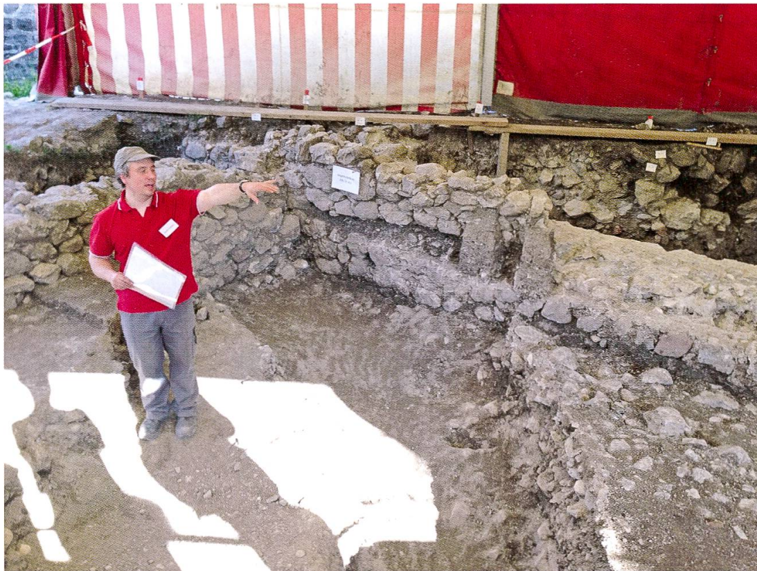
Weesen ist immer noch eine Fundgrube zur Geschichte des Mittelalters. Die vorläufig letzten Ausgrabungen fanden 2013 statt. (Bild aus: Kamm, Glarus – Zwischen Habsburg und Zürich)

Weesen vor den Toren des Glarnerlandes. Ab den 1970er-Jahren wurde das «mittelalterliche Pompeji der Ostschweiz» eingehend untersucht. Die Ausgrabungen belegen kleinstädtisches Leben, die Bedeutung Weesens als wichtiger Handelsknotenpunkt, Landwirtschaft innerhalb der Stadtmauern, einen gewissen Luxus, Weesens zeitweilige militärische Bedeutung, seine Zerstörung durch Feuer 1388 und vieles mehr. Seit dem Fund eines Römerkastells 2006 ist klar, dass die Gegend von Weesen seit dem 3. Jahrhundert besiedelt ist. Leider fehlt bis heute eine moderne Darstellung der Geschichte des Städtchens. Spätestens 2014 sollen zumindest die archäologischen Erkenntnisse zum mittelalterlichen Weesen in Buchform erscheinen.