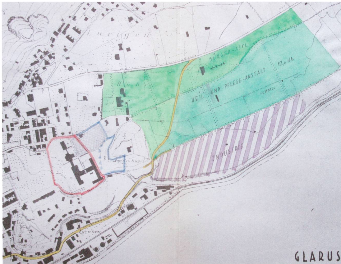
Die Umfahrungsstrasse von 1948 hätte durch das noch wenig überbaute Ygruben Richtung Insel und Bahnhof führen sollen. Gebaut wurde sie nie.

Trotz der im Vergleich zu heute lächerlichen Zahlen wurde das Problem des Durchgangsverkehrs bereits 1948 erkannt, eine einfache Lösung gab es aber offensichtlich auch damals nicht. Bereits 1948 wäre es bedeutend schwieriger gewesen, Glarus zu umfahren, als noch zwanzig Jahre früher. Erst recht zwanzig Jahre später: 1955 wurde die Landstrasse am nördlichen Ortsausgang verbreitert, ein Haus – dasjenige von Architekt Aebli – wurde abgerissen, das Problem des Durchgangsverkehrs blieb aber bestehen. 10 Finanzierung, Planung und Bau einer Umfahrungsstrasse scheinen 2011 immer noch in weiter Ferne.