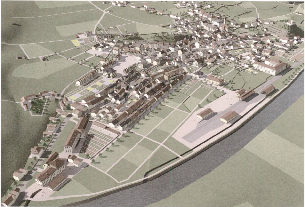
Glarus virtuell: die Modellansicht von Südosten.