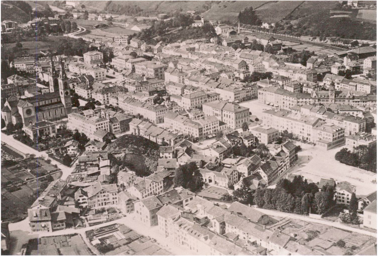
Altes und neues Carré-Glarus greifen im Sand und am Zaunplatz ineinander. Nicht immer «flüssig» genug, wie die Ortsplaner von 1948 fanden.