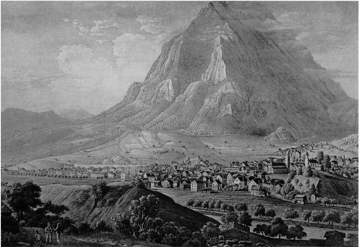
Glarus von Ennetbühls aus, um 1833. Aquatinta von Johann Baptist Isenring. (LAGL)