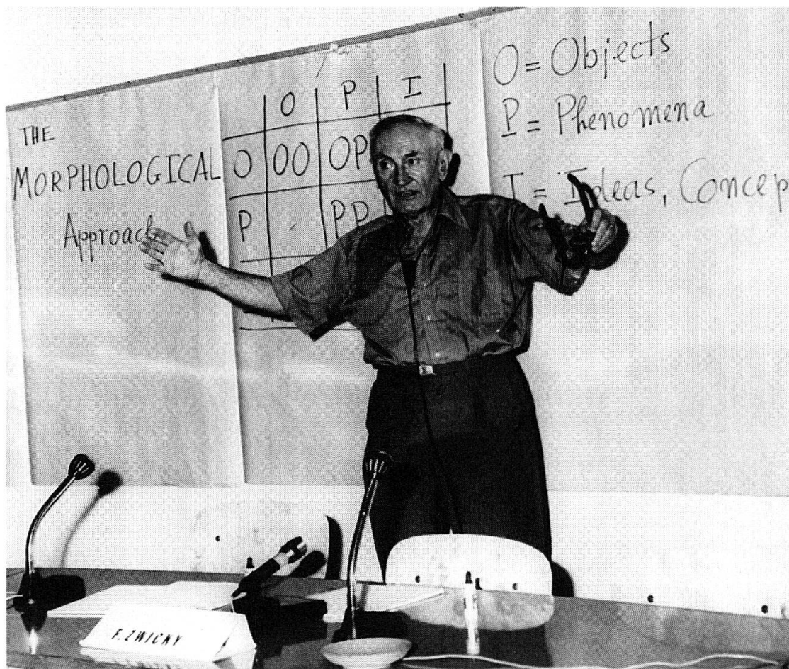
Prof. Fritz Zwicky an der Delos-Konferenz, Juli 1970, in Athen.