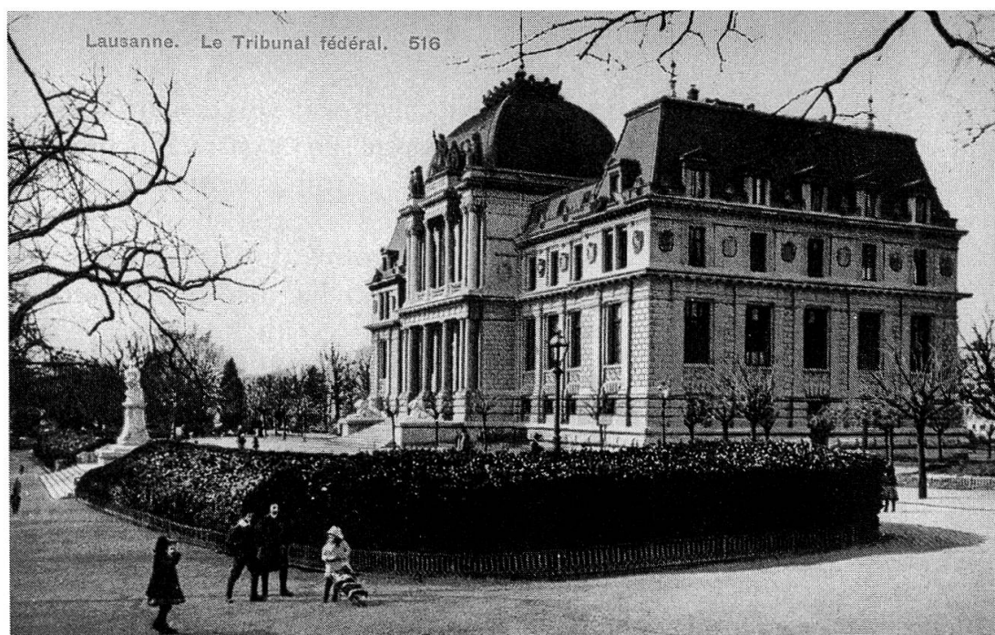
Ansicht des Bundesgerichtsgebäudes in Lausanne.