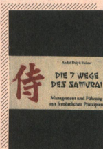
«Die 7 Wege des Samurai»

Ein Buch über Samurai an dieser Stelle? Samurai sind bekanntlich japanische Krieger. Über tausend Jahre lang gab es diese Krieger, die aber nicht nur durch ihre Kampfeskräfte, sondern auch durch Ehre, Ehrlichkeit, Höflichkeit, Respekt, Mitgefühl und andere japanische Werte bekannt waren. Und um diese geht es in diesem Buch. Es ist kein Buch über Kampfsport, sondern ein Buch über inspirierendes Führen. Der Autor ist der festen Überzeugung, dass wir von den Samurai viel lernen können. Alle Geschichten in diesem Buch von berühmten Samurai und Zen-Meistern sowie Begegnungen mit japanischem Lebensstil und Management sollen nicht als Ideologie, als letztendliche Wahrheit verstanden werden. Es ist nur ein Angebot, sich zu überlegen, welche Aspekte und Übungen, die im Buch beschrieben werden, für einen selber nützlich sein könnten und welche man für seinen eigenen Führungsstil umsetzen kann. Das Buch ist in einer einfachen und verständlichen Sprache geschrieben.