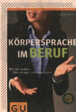
«Körpersprache im Beruf»

Immer wieder kann es vorkommen, dass sich ein Gast unwohl fühlt, obwohl ihn die Mitarbeitenden an der Réception oder im Service freundlich behandeln. Der Grund dafür kann sein, dass die Freundlichkeit nur gespielt ist und die Körpersprache etwas anderes sagt. Und das merken die Gäste sehr wohl. Dasselbe gilt bei Gesprächen mit dem Chef. Der Körper spricht immer mit. So ist er auch Bestandteil jeder Karriere. Wer seine Meinung mit den passenden Gesten und Signalen zu unterstreichen weiss, wirkt souverän und mitreissend zugleich. Auch die richtige Einschätzung des Gegenübers vereinfacht das Arbeitsleben enorm. Dieses Buch illustriert, was die Körpersprache alles verrät und wie man es besser machen kann. Erfahren Sie, wie Sie den Erfolgsfaktor Körpersprache optimal nutzen – sei es beim Vorstellungsgespräch, beim Mitarbeitergespräch oder im Umgang mit Gästen. (mgs)