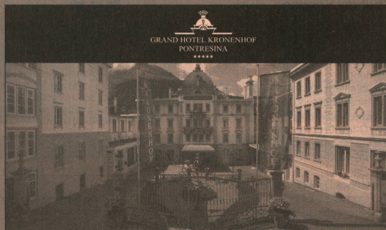
GRAND HOTEL KRONENHOF PONTRESINA *****

Das 5-Sterne-Superior-Haus Grand Hotel Kronenhof in Pontresina gehört zu den architektonisch bedeutendsten Alpenhotels des 19. Jahrhunderts. Die 112 luxuriösen Suiten und Zimmer sowie die imposante Wellnessanlage laden unsere Gäste zur Erholung und Entspannung ein. Kulinarisch wird man im schönsten neubarocken Grand Restaurant der Alpen sowie im Gourmet-Restaurant Kronenstübli verwöhnt.