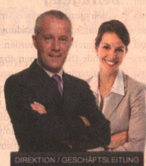
DIREKTION / GESCHÄFTSLEITUNG

Die Stellenplattform für Hotellerie, Gastronomie und Tourismus.