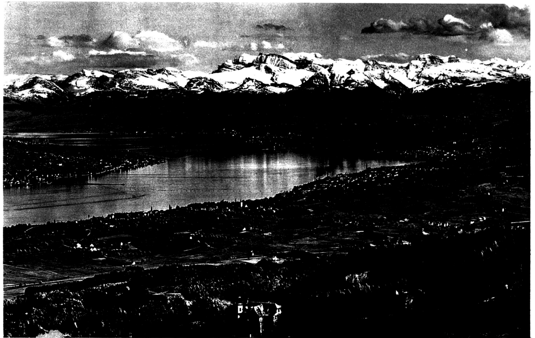
Uetliberg — Blick auf Zürichsee und Glärnisch

Im Zürcher Hauptbahnhof wickelt sich zu dem stark ausgebildeten Vororts- und intern-schweizerischen Verkehr auch ein bedeutender internationaler Verkehr ab. Direkte Schnellzüge, Luxuszüge und Schlafwagen laufen von allen grösseren Städten des europäischen Kontinents hier zusammen und strahlen von hier wieder aus. Nach dem