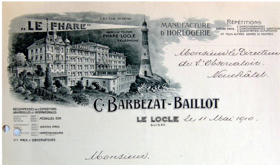
Fig. 5. Le Locle, fabrique d'horlogerie Le Phare, 1896–1908. En-tête d'une lettre envoyée le 11 mai 1910.

offrent aux architectes une panoplie de solutions pour exprimer la position sociale de chacun. L'opposition entre habitats patronal et ouvrier ne doit toutefois pas occulter l'éventail des constructions de standings intermédiaires destinés aux chefs d'ateliers, aux employés administratifs et commerciaux, sans oublier les «petits» patrons. 6