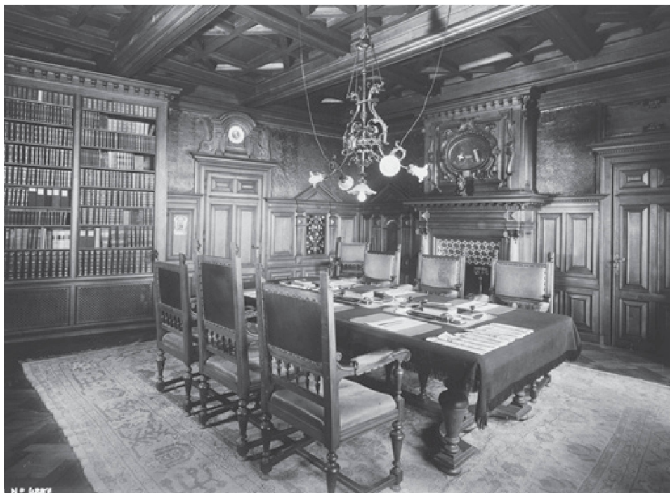
Fig. 4. Neuchâtel, Château, salle du Conseil d'Etat, aménagement par l'architecte Jean Béguin, 1898.