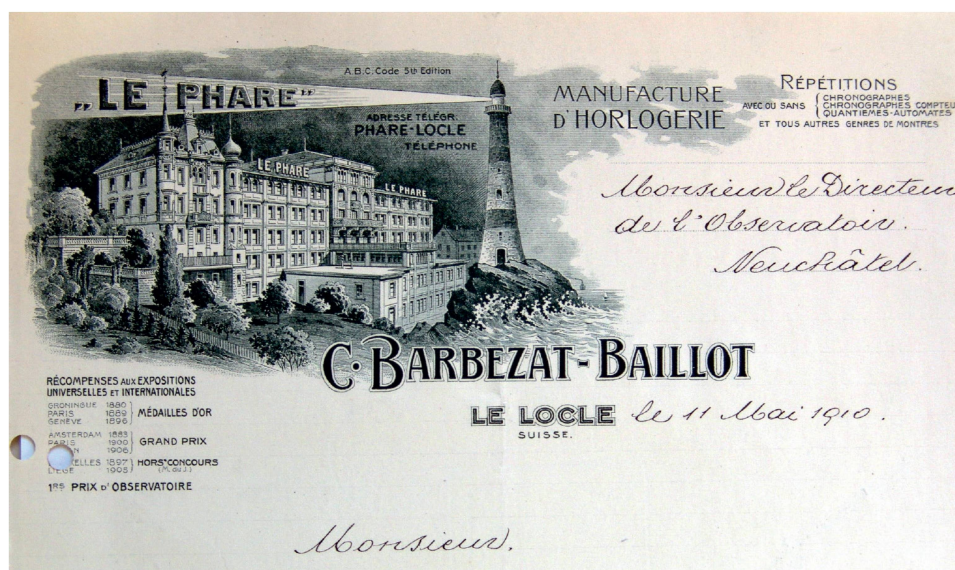
Fig. 5. Le Locle, fabrique d'horlogerie Le Phare, 1896–1908. En-tête d'une lettre envoyée le 11 mai 1910.

offrent aux architectes une panoplie de solutions pour exprimer la position sociale de chacun. L'opposition entre habitats patronal et ouvrier ne doit toutefois pas occulter l'éventail des constructions de standings intermédiaires destinés aux chefs d'ateliers, aux employés administratifs et commerciaux, sans oublier les «petits» patrons. 6