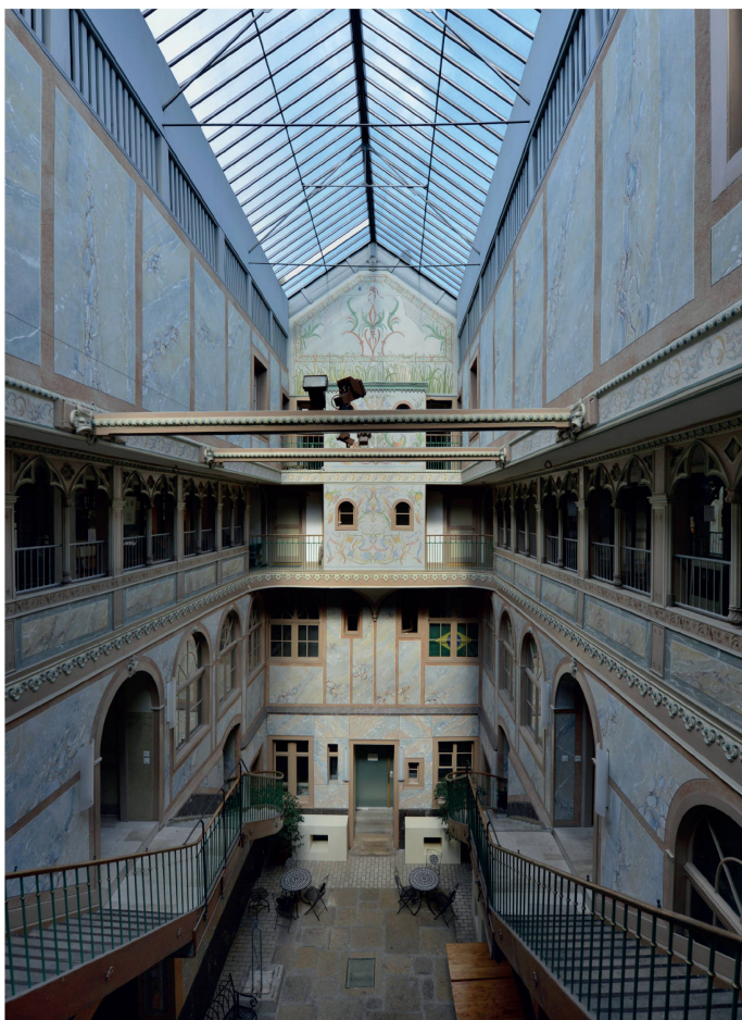
Fig. 1. La Chaux-de-Fonds, Ancien Manège, cour intérieure et son décor rafraîchi vers 1902.