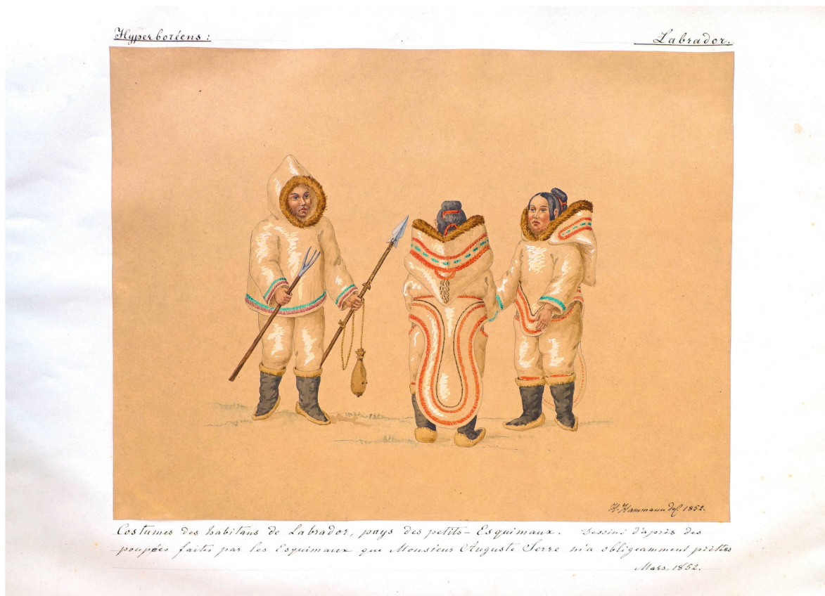
Fig. 3. Hermann Hammann, Costumes des habitants du Labrador, crayon, encre et aquarelle, 1852, dans Histoire de l'Ornement – Collection Hermann Hammann , tome 1.2, planche 12 © BAA.