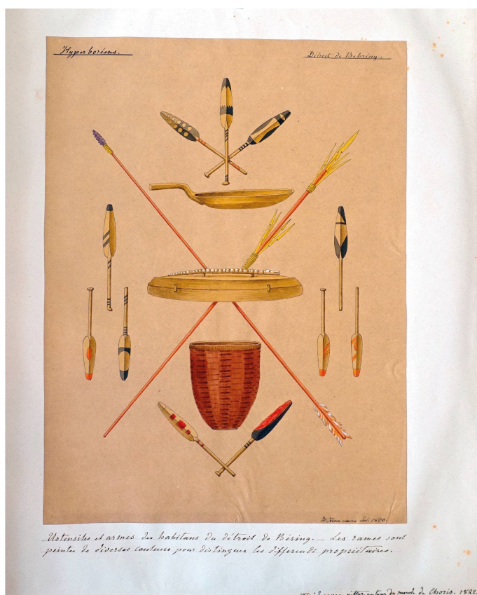
Fig. 4. Hermann Hammann, Ustensiles et armes des habitants du Détroit du Béring, crayon, encre et aquarelle, 1850, dans Histoire de l'Ornement – Collection Hermann Hammann, tome 1.2, planche 4 © BAA.