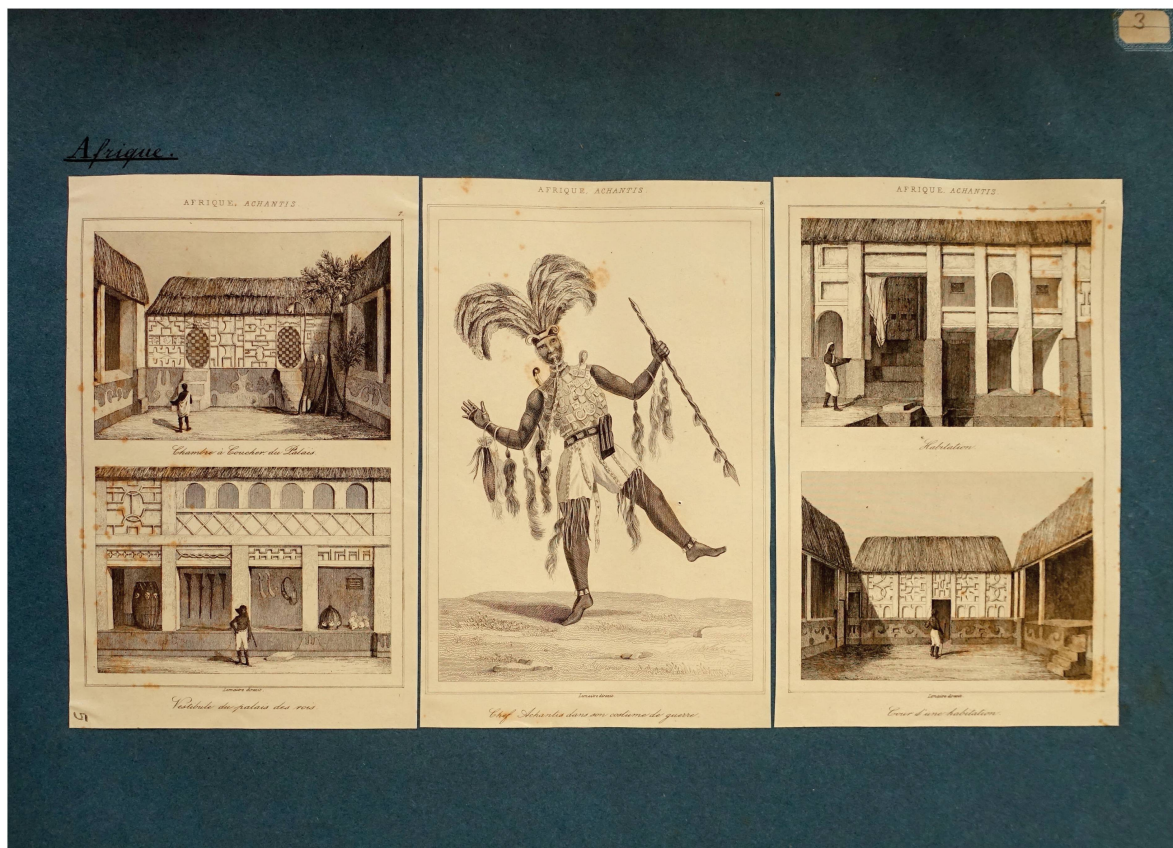
Fig. 5. Planche illustrant des architectures et costumes de l'Afrique Achantis tirées de M.F. Hoefler, Afrique australe... tome 5 ( L'univers pittoresque ), gravures sur acier, dans Histoire de l'Ornement – Collection Hermann Hammann , tome 10, planche 5 © BAA.