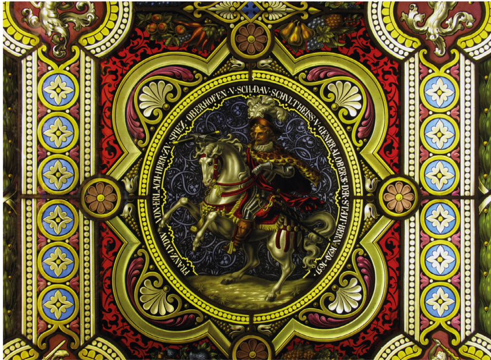
Abb. 4. Glasgemälde, ehemals im Gartensaal von Schloss Oberhofen, August Spiess und Ludwig Stantz, 1864.

senschaftliche Disziplin etablierte, eine Folge des gewachsenen Interesses insbesondere für das Altertum und das Mittelalter. Die Auseinandersetzung mit der Geschichte strahlte auch auf alle Bereiche der künstlerischen Produktion aus, auf Malerei, Architektur, Literatur und erfasste selbst Oper und Theater. Diese Entwicklung wird in unseren Augen paradoxerweise als modern wahrgenommen, aber gleichzeitig zeugt sie von einer Beliebigkeit, die sich vor allem in den Innenräumen bemerkbar macht.