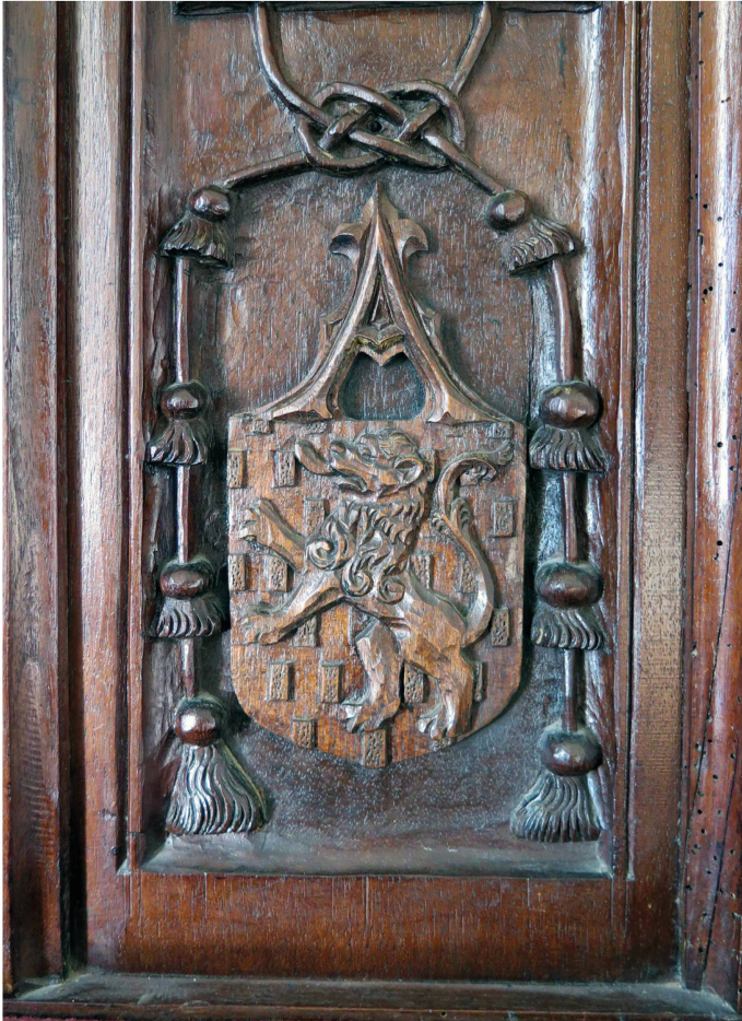
Abb. 8. Schloss La Sarraz, Rittersaal, Detail einer «gotischen» Anrichte, Mitte des 19. Jahrhunderts.

erwähnt und dazu bestimmt, in die Familiensammlung aufgenommen zu werden. Um 1900 wurde es im grossen Wohnzimmer ausgestellt.