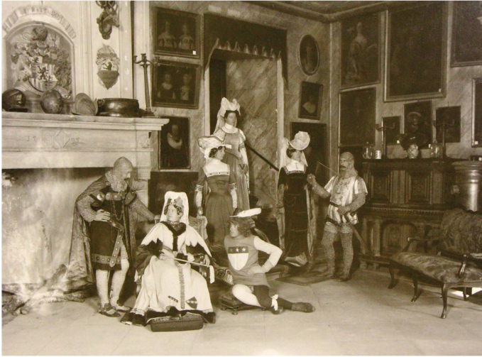
Abb. 1. Ein Maskenball im Schloss La Sarraz, um 1900, anonyme Aufnahme. Schloss La Sarraz, fotografische Sammlung. Fotografie von Dave Lüthi, 2013.

mene Historisierung der Innenräume ignorierte Moden und Trends: Moderne Möbel, antike Gemälde und importiertes Porzellan existierten scheinbar wahllos nebeneinander, um den Verlauf der Geschichte vor Augen zu führen, oder besser gesagt: «die gute alte Zeit» zu evozieren. Diese künstliche Schichtung, die gelegentlich an einen Basar erinnert, wurde bewusst vorgenommen, um Familien mit Tradition von solchen (noch) ohne Tradition zu unterscheiden. Zwei Schweizer Beispiele erlauben es uns, diese beiden Fälle nachzuzeichnen.