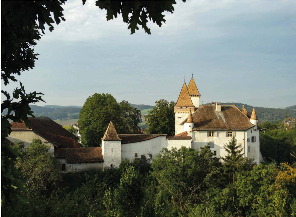
Abb. 5. Schloss La Sarraz, Gesamtansicht von Osten.

liensitz wurde. Bei dem Schloss handelte es sich um den Besitz der ältesten Söhne, die während des gesamten Ancien Régime den Titel eines Barons trugen. Obwohl die Stadt und die Republik Bern 1536 die Waadt annektiert hatten, hatte Bern die Lehensherrschaften beibehalten, um sich die Unterstützung ehemaliger Adelsfamilien zu sichern. Die Familie de Gingins nahm in dieser sehr eigentümlichen politischen Gemengelage einen ganz besonderen Status ein: Sie gehörte zu den letzten Adelsgeschlechtern mittelalterlichen Ursprungs, welche bis zur Revolution überlebte. Gleichzeitig waren sie eine der wenigen Waadtländer Familien, die dem Berner Patriziat angehörten. Tatsächlich war François II 1522 Bürger von Bern geworden, worauf die Familie sehr stolz war. 7