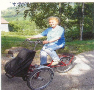
Shoppi auch mit Motor lieferbar!