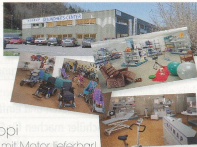
Shoppi auch mit Motor lieferbar!