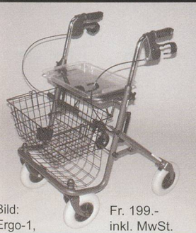
Bild: Ergo-1, Fr. 199.- inkl. MwSt.

Machen Sie den Preisvergleich.. es lohnt sich!