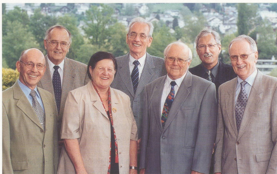
Ihr «ZKB-Beraterteam 60 plus»