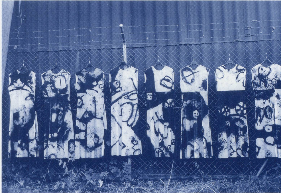
Getragene Kleider 98

Dienstag, 29. Februar 2000 von 18.00 bis 19.30 Uhr Zug, Pro Senectute, General-Guisan-Strasse 22