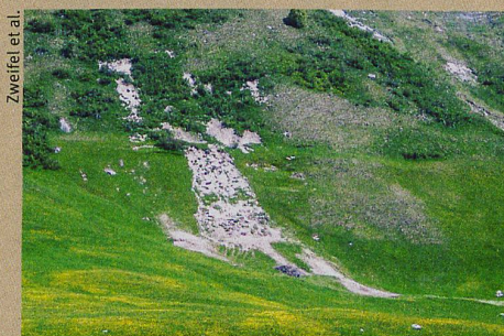
Die Erosion hat diesem Hang im Urserental zugesetzt. Hauptursache dafür: die Viehhaltung.

L. Zweifel et al.: Spatio-temporal pattern of soil degradation in a Swiss Alpine Grassland. Remote Sensing of Environment (2019)