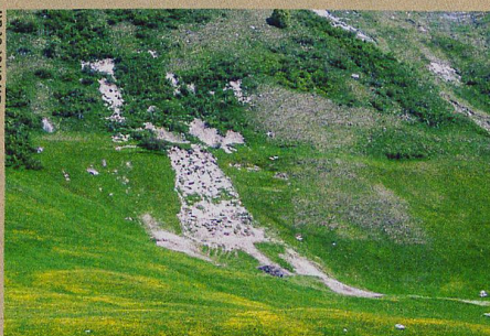
Die Erosion hat diesem Hang im Urserental zugesetzt. Hauptursache dafür: die Viehhaltung.