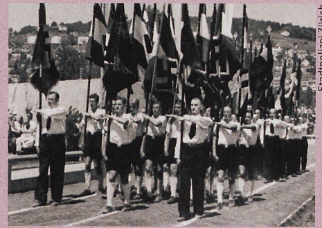
Die «Deutsche Kolonie in der Schweiz» marschiert 1941 durchs Stadion Letzigrund.