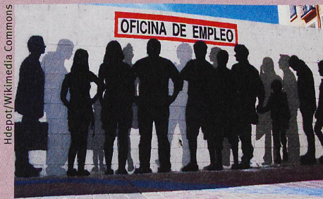
Ein Graffiti im spanischen Zaragoza thematisiert die Arbeitslosigkeit im Land.

M. Vacchiano et al.: The family as (one- or two-step) social capital: mechanisms of support during labor market transitions. Community, Work and Family (2019)