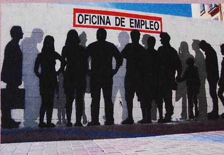
Ein Graffiti im spanischen Zaragoza thematisiert die Arbeitslosigkeit im Land.

M. Vacchiano et al.: The family as (one- or two-step) social capital: mechanisms of support during labor market transitions. Community, Work and Family (2019)