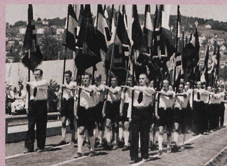
Die «Deutsche Kolonie in der Schweiz» marschiert 1941 durchs Stadion Letzigrund.