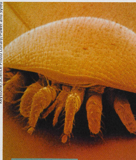
Biologie und Medizin