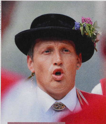
Kultur und Gesellschaft