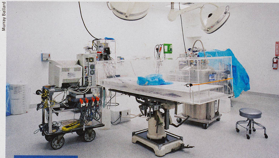
Wissen und Glauben