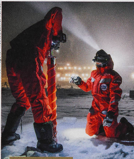
Umwelt und Technik