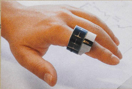
Wer dieses Mini-Pulsoximeter trägt, weiss über seine Vitalfunktionen Bescheid.