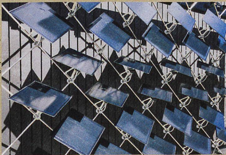
Wie eine Sonnenblume: Die beweglichen Fotovoltaikelemente richten sich nach der Sonne aus.

B. Svetozevic et al.: Dynamic photovoltaic building envelopes for adaptive energy and comfort management. Nature Energy (2019).