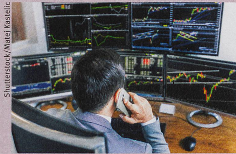
Spekulationsirrtümer sind nicht das alleinige Werk von Börsenhändlern.