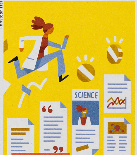
Wissen und Politik