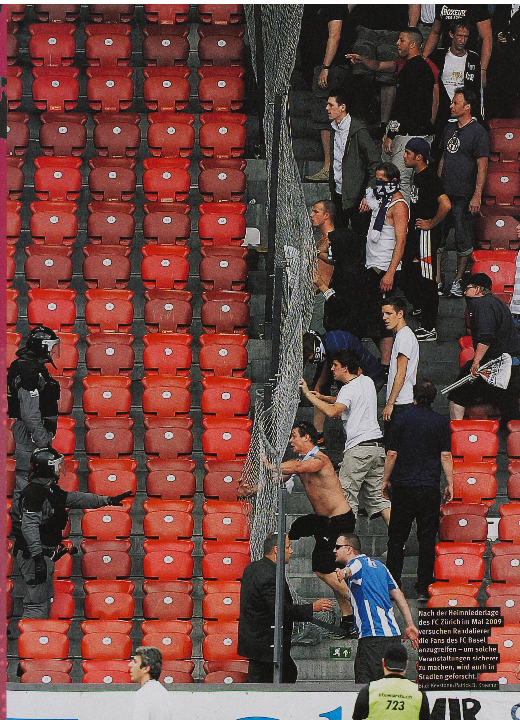
Nach der Heimmiederlage des FC Zürich im Mai 2009 versuchen Randalierer die Fans des FC Basel anzugreifen – um solche Veranstaltungen sicherer zu machen, wird auch in Stadien geforscht.