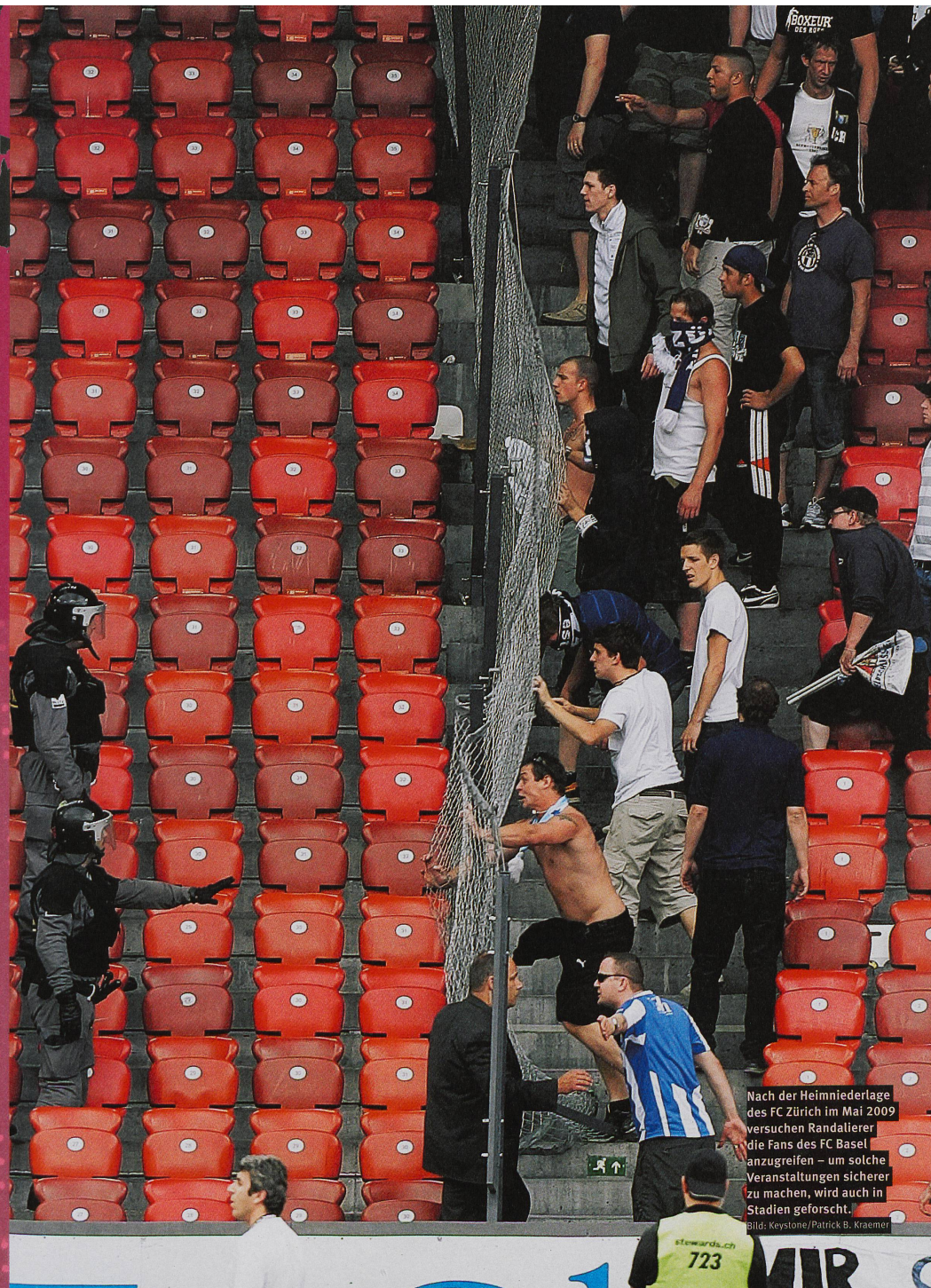
Nach der Heimmiederlage des FC Zürich im Mai 2009 versuchen Randalierer die Fans des FC Basel anzugreifen – um solche Veranstaltungen sicherer zu machen, wird auch in Stadien geforscht.