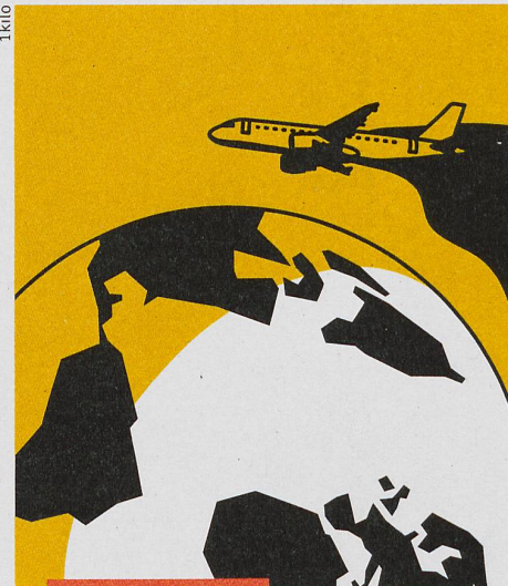
Wissen und Politik