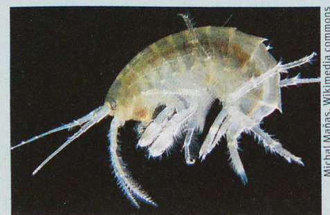
Bachflohkrebsen sind äusserst empfindlich auf gewisse Pestizide.

N. A. Munz et al.: Internal Concentrations in Gammarids Reveal Increased Risk of Organic Micropollutants in Wastewater-Impacted Streams. Environmental Science & Technology (2018)