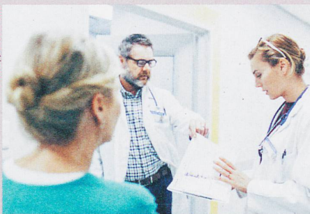
Fehler vermeiden: Vorgesetzte sollten die Mitarbeitenden um ihre Meinung fragen.